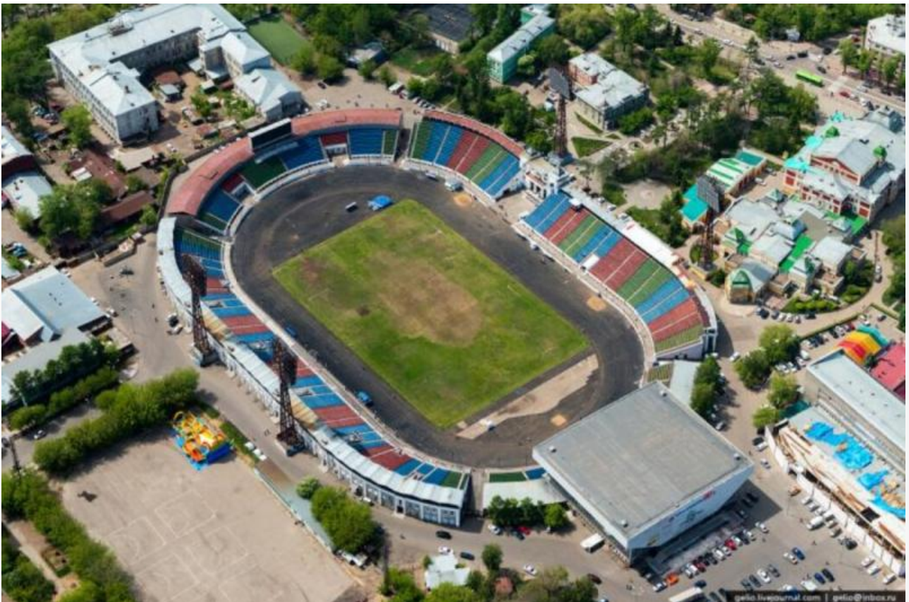
Стадион «Труд» — лакомый кусочек земли в центре города

Мы проанализировали бухгалтерскую отчетность этой организации (предоставлена ФНС). И то, что мы увидели, не выдерживает никакой критики.