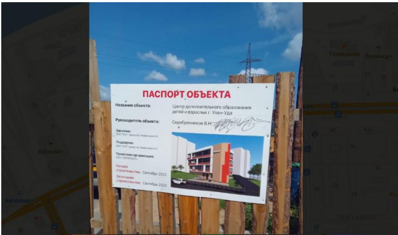
Паспорт объекта на Жердева с датой окончания работ — 2023 год

Мэрия города ничего не сообщает о недострое в 18 квартале, хотя сроки сдачи по документам вышли ещё в 2023 году. Ждём официальных ответов от городских властей.