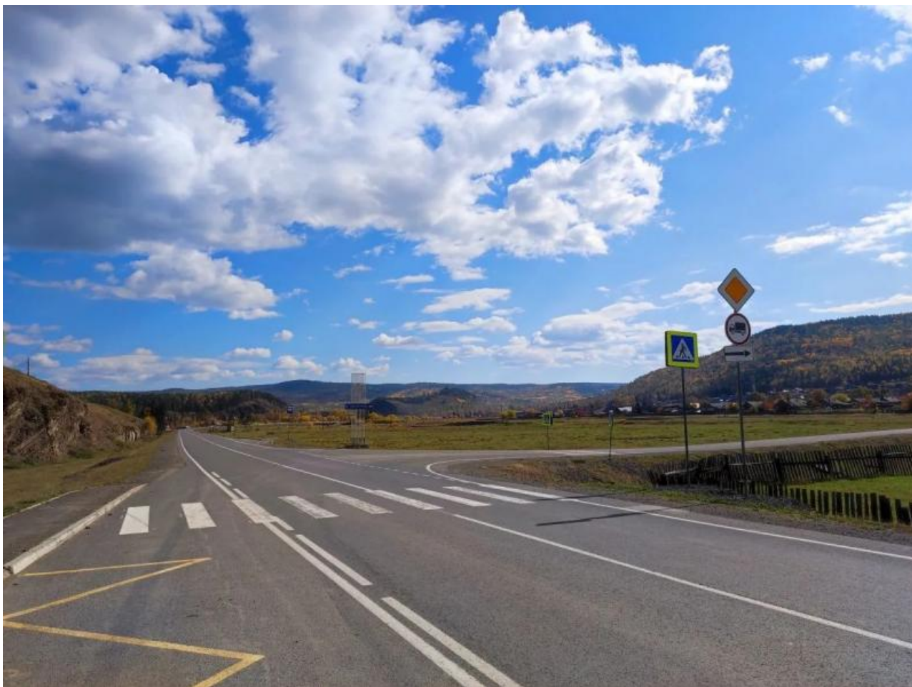
Фото – пресс-служба Т2.

Автор: Александр Макаров © Babr24.com ИНТЕРНЕТ И ИТ, ИРКУТСК 👁 15 13.05.2026, 20:15