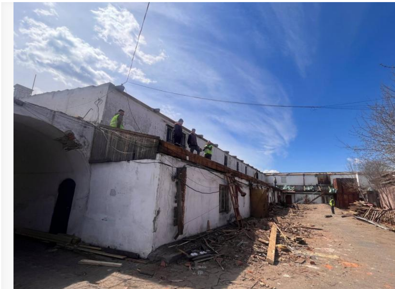
Рабочие демонтируют крышу Гостиных рядов

гастрофестиваля «Амтатай». В проектных презентациях чиновники показали, что у будущих рядов будет гладкая красная крыша и ночная архитектурная подсветка.