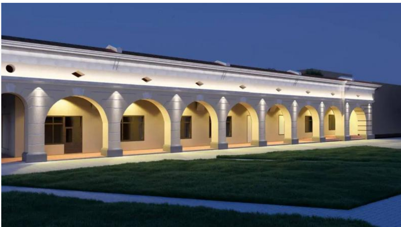
3D-рендер обновлённых Гостиных рядов