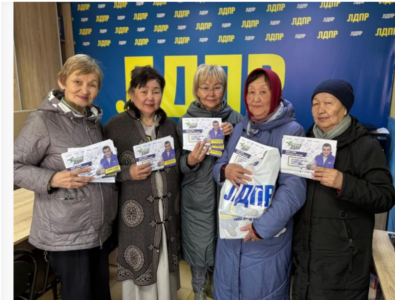
Пенсионеры в офисе БРО ЛДПР держат в руках наборы семян с портретом Слуцкого на упаковке

В штабе ЛДПР в Бурятии решили, что житель условного Заиграево больше озабочен ценой на борщевой набор, чем политикой. Проект «Грядка ЛДПР» — это очевиднейший идейный кризис в партии. Когда нет харизмы Вольфовича, способной держать электорат в тонусе одним криком, в ход идут пакетики с укропом.