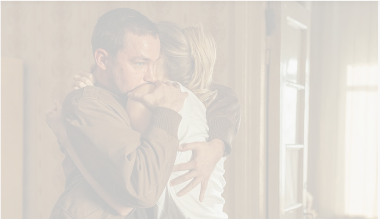
Кадр из фильма «Коммерсант»

«Для того чтобы возник такой «сарафан», безусловно, нужен был хороший фильм, который попадает в сердца людей, когда зритель действительно верит и его без прорыва захватывает происходящее на экране. Всё это есть в «Коммерсante». И я очень рад, что началась эта волна, и пусть она не заканчивается», – сказал в интервью «Бюллетеню кинопрокатчика» Александр Петров, впервые выступивший не только как актёр, но и как креативный продюсер картины.