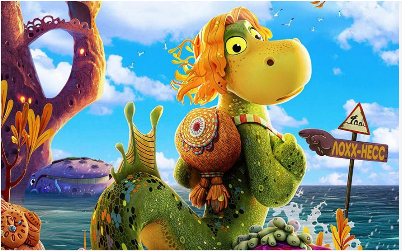
Постер к фильму «Несси. Чудище из Лохх-Несс»