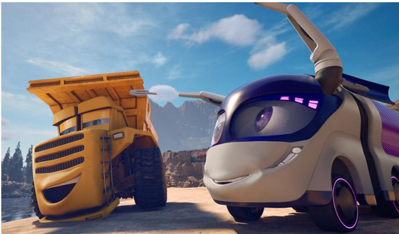
Кадр из фильма «Грузовички»