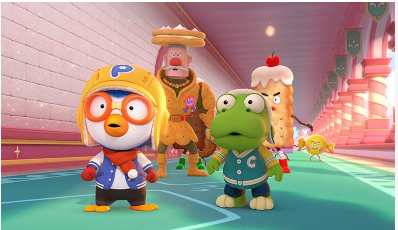
Кадр из фильма «Пингвинёнок Пороро. Приключения в мире сладостей»