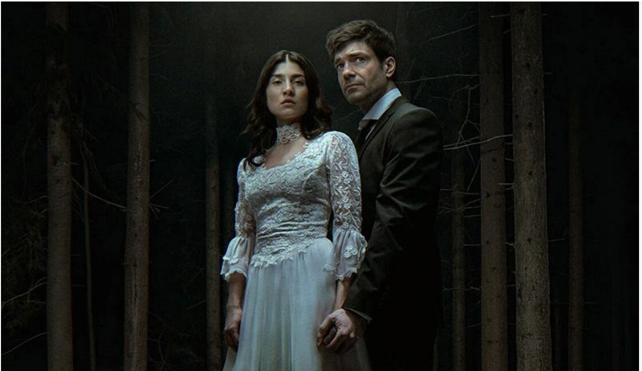
Постер к фильму «Шурале»