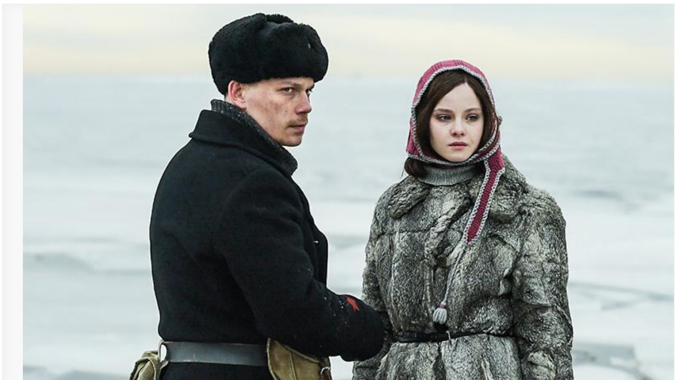
Кадр из фильма «Ангелы Ладого»

Также сохранили места в десятке лидеров проката « Вот это драма! » (51,4 миллиона с потерей в сборах 36 % и пятое место), « Приключения жёлтого чемоданчика » (27,1 миллиона с потерей в сборах 30 % и восьмое место) и « Твоё сердце будет разбито » (24,3 миллиона с потерей в сборах 33 % и девятое место).