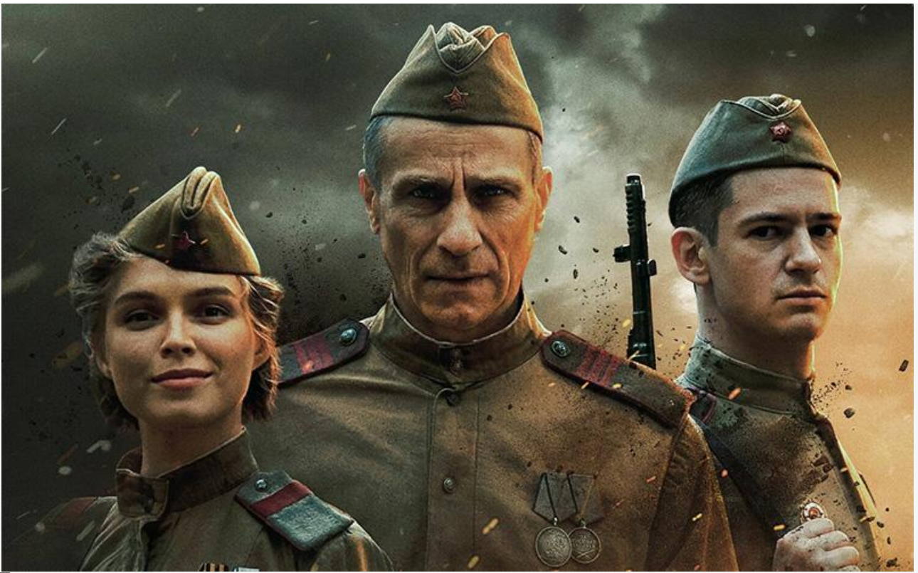
Постер к фильму «Отец»