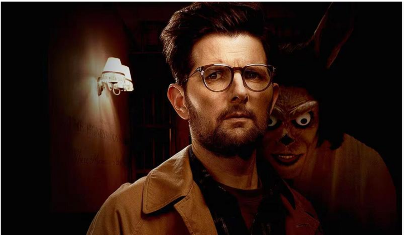
Постер к фильму «Хокум»

Также выходят на экраны американская комедия Альфредо Барриоса-младшего «Как стать миллиардером» (18+), американская комедийная мелодрама братьев Киннэн «Холостяк в Италии» (18+) с Кевином Джеймсом и два мультфильма: германско-бельгийский «Несси. Чудище из Лохх-Несс» и южнокорейский «Пингвинёнок Пороро. Приключения в мире сладостей» .