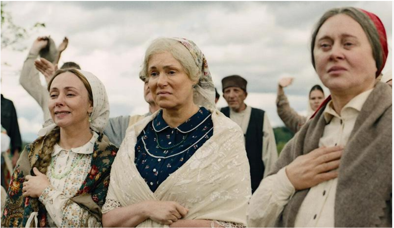
Кадр из фильма «Семь вёрст до рассвета»