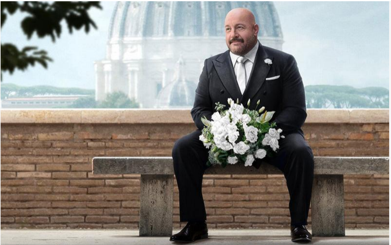
Постер к фильму «Холостяк в Италии»

В формате переиздания зрители смогут посмотреть на большом экране отреставрированный в формате 4K экшн-триллер Кэтрин Бигелоу 1991 года «На гребне волны» (18+) с Патриком Суэйзи и Киану Ривзом и аниме Ясухио Ёсиуры 2013 года «Патэма наоборот» .