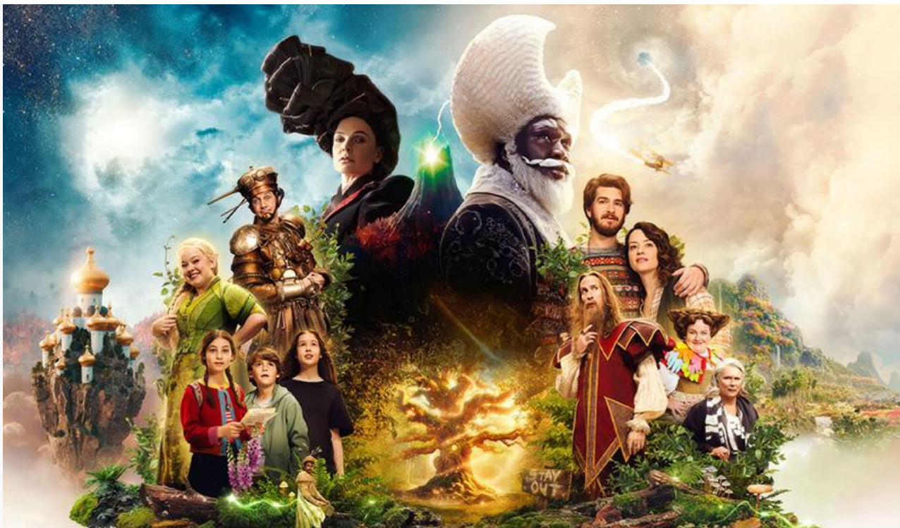
Постер к фильму «Вверх по волшебному дереву»

Ну а главной новинкой длинных выходных должно стать ориентированное на семейную аудиторию британское приключенческое фэнтези Бена Грегора по мотивам серии книг Энид Блайтон « Вверх по волшебному дереву » с Клэр Фой и Эндрю Гарфилдом в главных ролях.