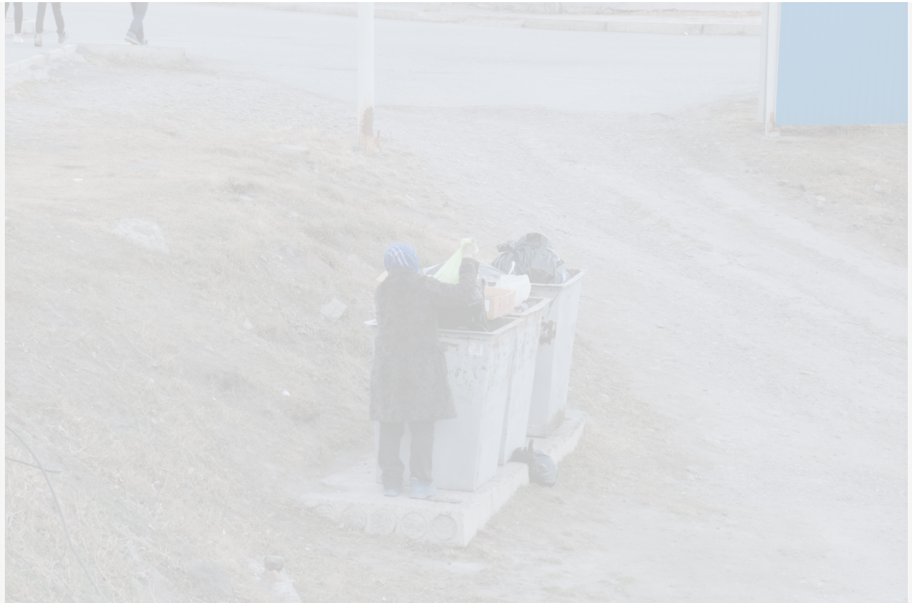
Автор: Алёна Штерн Фото из альбома "Красноярск. Андеграунд" © Фотобанк "RuBabr"

→ Мусорная реформа по-красноярски. Новые площадки, старые проблемы и один неудобный вопрос: куда делась «обработка»?