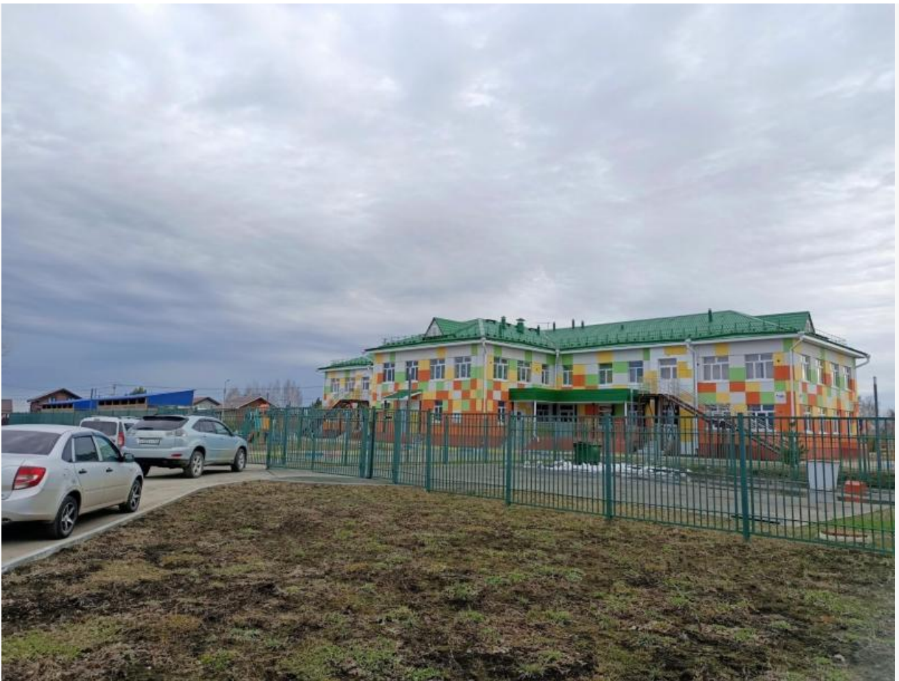
Детский сад №24