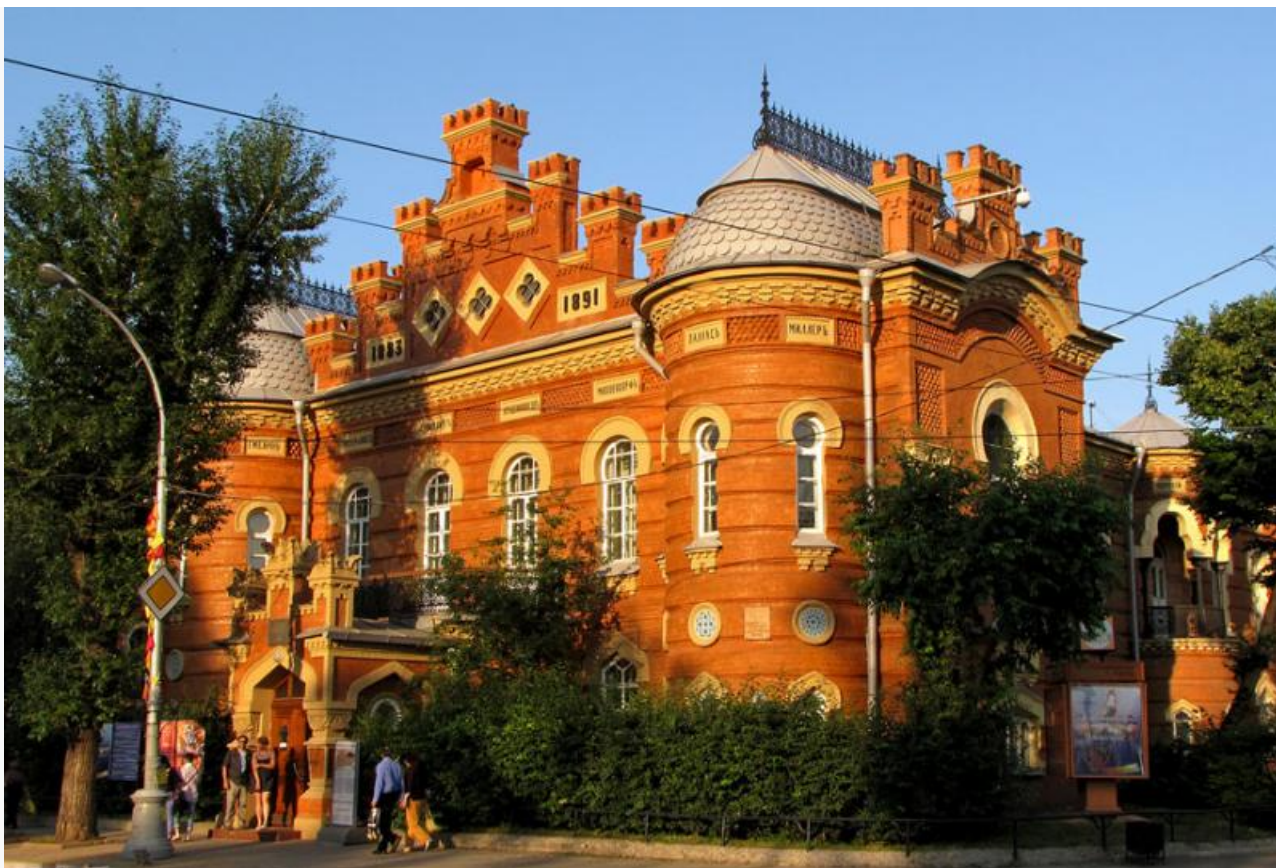
Гостиница соседствует с областным краеведческим музеем

Сейчас вопрос по улице Баррикад уже в поле зрения надзорного ведомства. Материалы по объекту поступали в прокуратуру и ранее – претензии к застройке поднимались неоднократно. Сейчас есть риск перерастания ситуации в полноценную проверку с возможной приостановкой работ или требованием привести проект в соответствие с нормами.