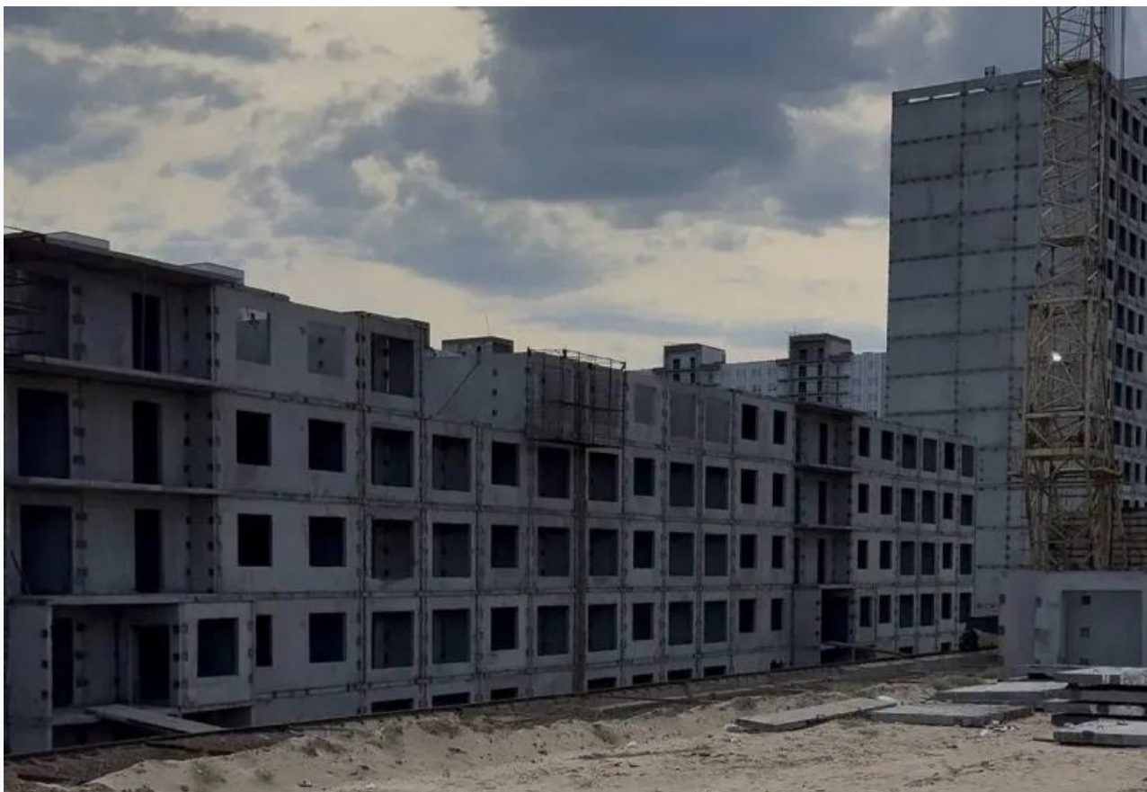
Заброшенная стройплощадка в 148-м квартале

Министр строительства Бурятии Тимур Цыренжапов отказался называть компанию, которая сменит «МосКомСтрой» на площадке «Мегаполиса». Только вот установленный законом порог в 100 тысяч «квадратов» отсекает почти всех местных игроков. Столь крупные объёмы в республике под силу только федеральным гигантам уровня группы «ПИК».