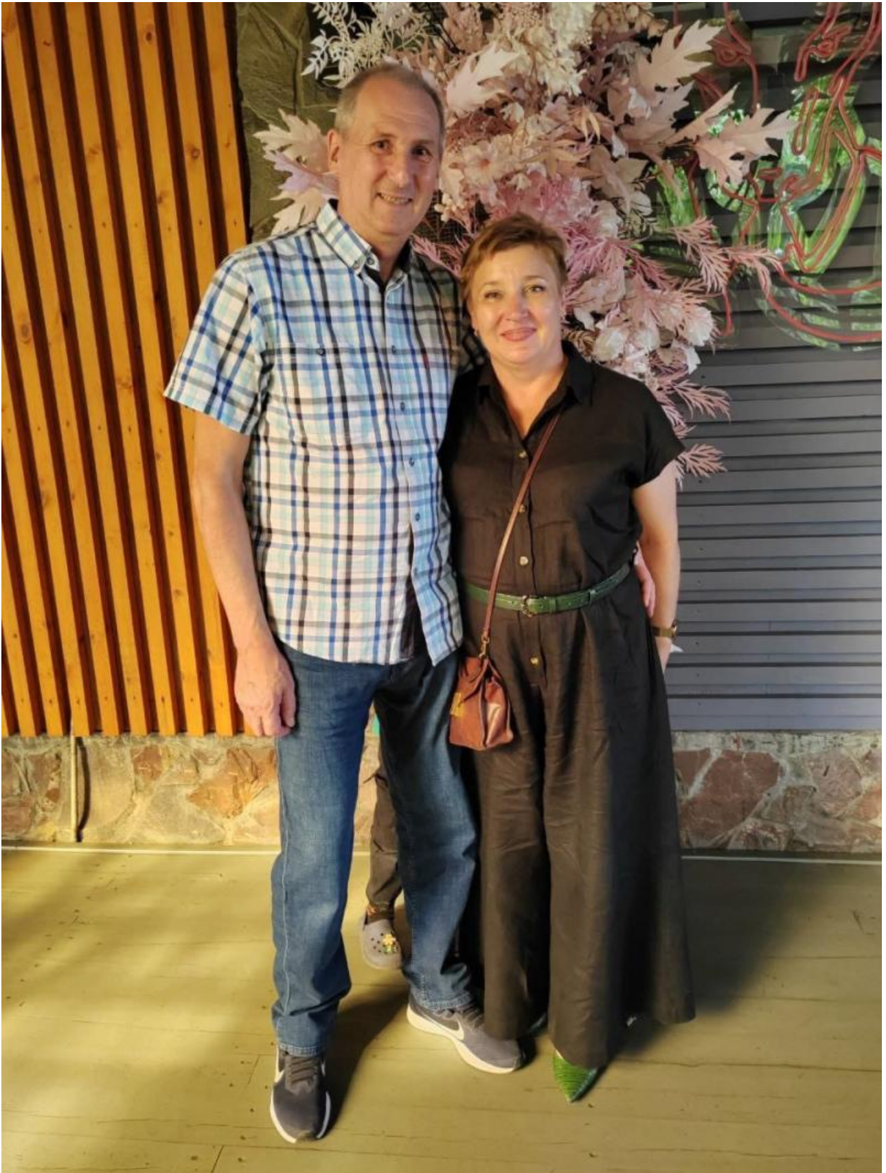
постили фоточки с отдыха (это август 2024 года).