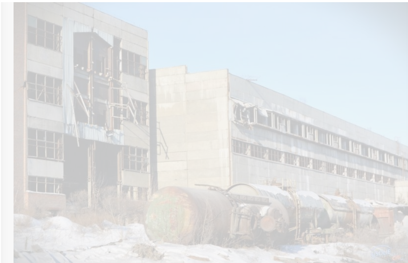
Вот они: останки «Усольехимпрома»

Посему вместо свалки в Усолье-Сибирском федералы хотят сделать Федеральный центр химии. Инвестиции в развитие составят 830 миллиардов рублей на 10 лет, якорный инвестор – «Росхим». Проект одобрен на стратегической сессии у Мишустина. И пока не начал претворяться в жизнь. Но когда-нибудь обязательно начнет. Зря что ли Усолье первое ввело себе туристический налог. Повалит народ со всей страны поднимать с колен химическую промышленность страны да на столицу этой самой промышленности любоваться.