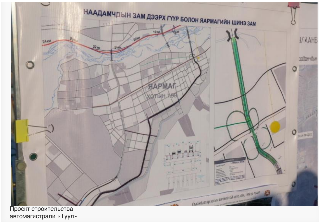
Проект строительства автомагистрали «Туул»

Между тем настоящий удар по всей этой истории с рекой пришёл с другой стороны. Пока обсуждали дорогу, специалисты провели новые анализы воды в Тууле. И оказалось, что водоём в городе кишит бактериями, среди которых есть и кишечная палочка. В районе биокombината показатели уходят в предельные значения – вода здесь уже опасна для человека.