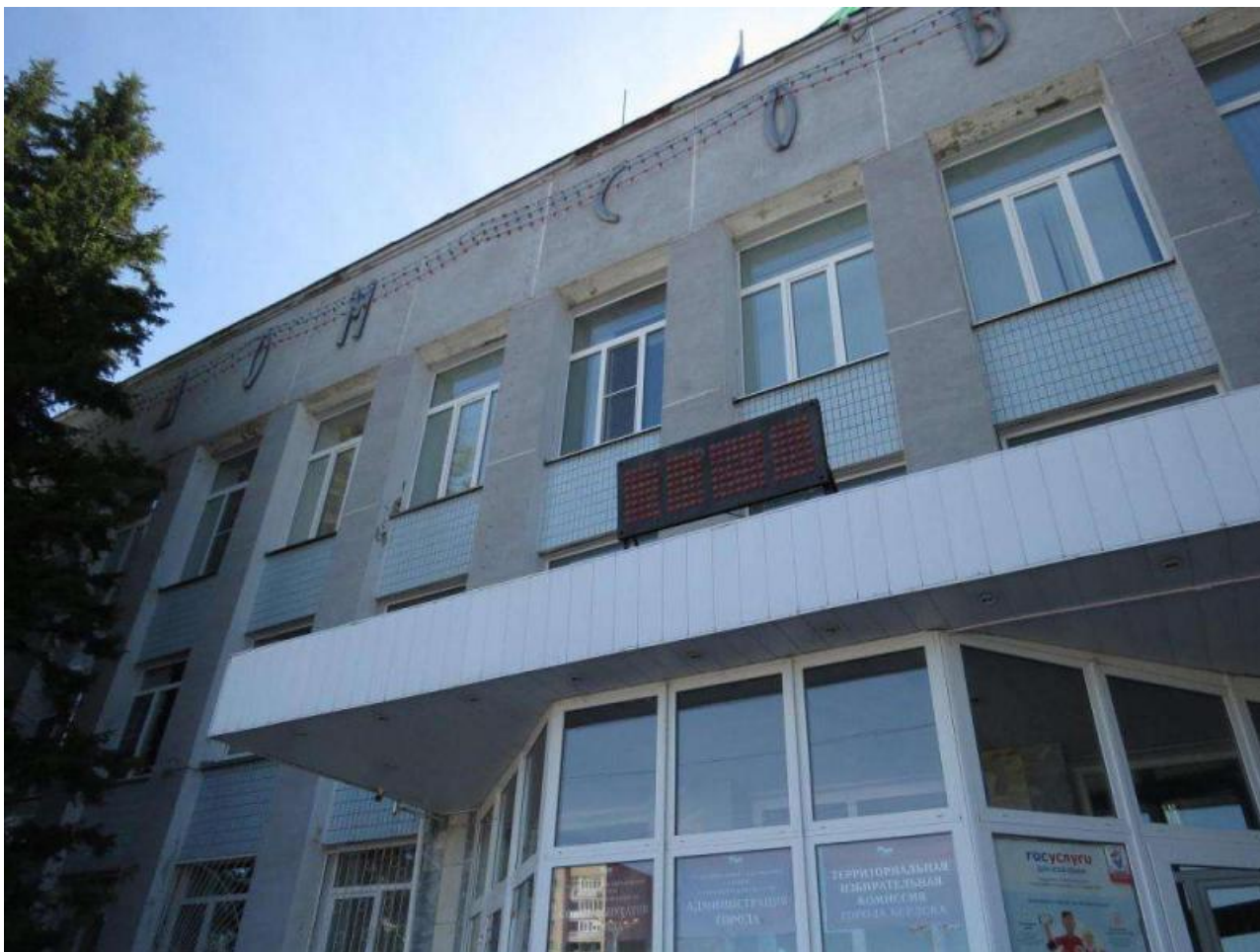
Фото: Бердск Онлайн

Автор: Ярослава Грин © Babr24.com Источник: t.me/arhvlasi ПОЛИТИКА, НОВОСИБИРСК 👁 368 23.04.2026, 07:51