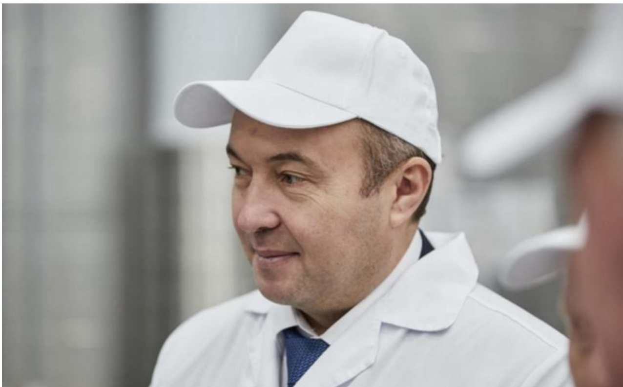
Фото: Александр Ощепков

Автор: Ярослава Грин © Babr24.com Источник: t.me/sidpolit ПОЛИТИКА, ЭКОНОМИКА, НОВОСИБИРСК 9 21.04.2026, 19:41