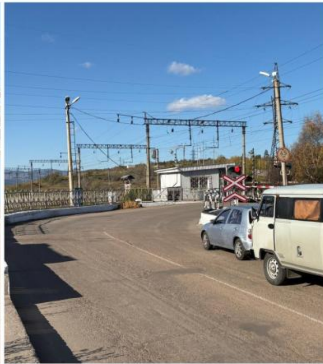
Существующий железнодорожный переезд в районе Стеклозавода часто парализован пробками

Отметим, что в апреле 2025 года суд в Чите взыскал с ООО «ТС Строй» более 17,5 миллиона рублей долга перед местным подрядчиком. Так что местному бизнесу следует относиться с осторожностью к генподрядчику.