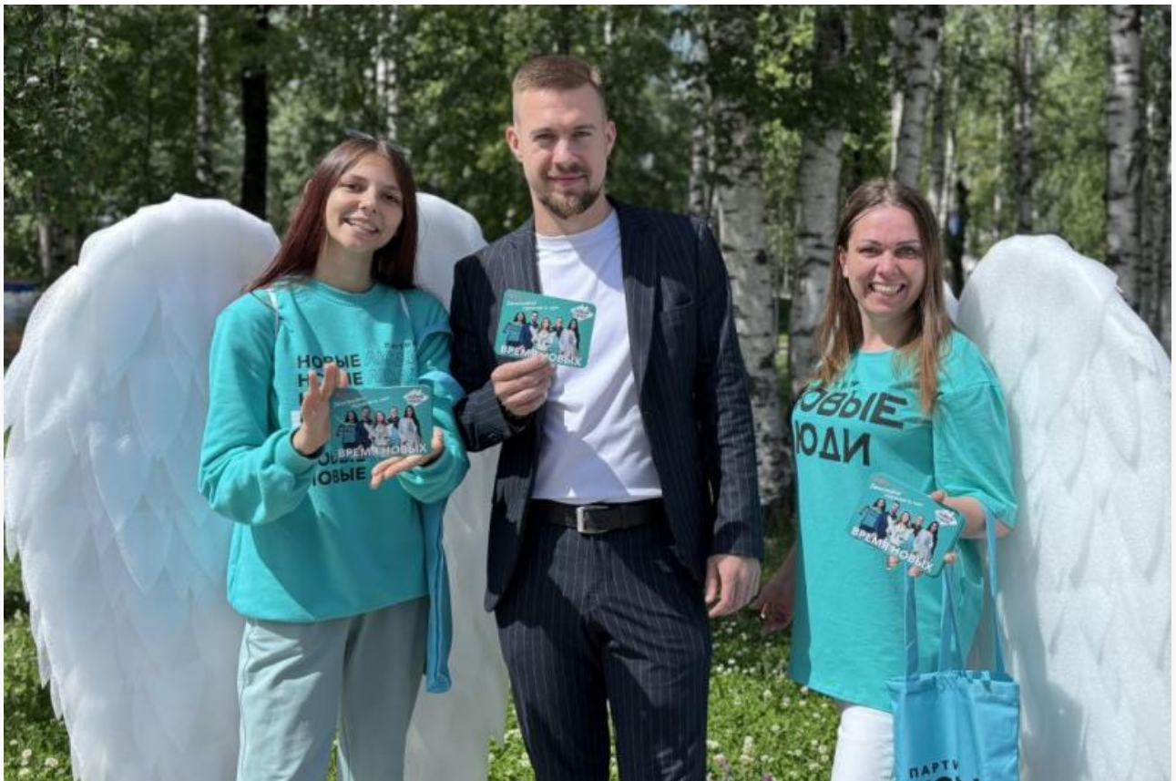
Не зря ангельские крылья примеряли