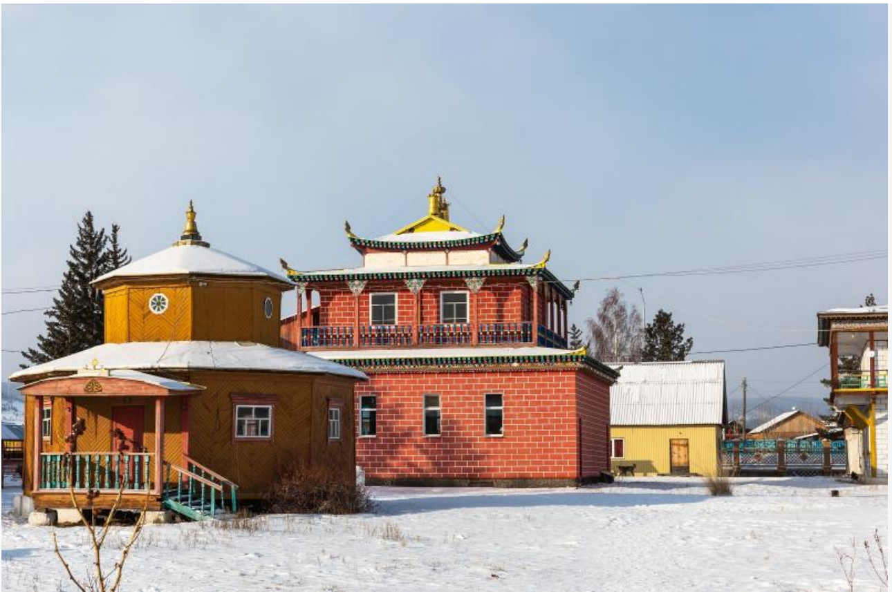
Дацан в предместье Рабочем

Начнем с простого. Предместье Рабочее, где это происходит, и так активно застраивается в последние годы. Причем важно отметить, что застраивается – точно. То есть, новые жилые комплексы возникают как грибы, но школ и детских садов к ним не прилагается. А те, что есть, – две обычные школы и один лицей, куда возят детей со всего города, – забиты под завязку. Расширения не планируется. Учиться негде. Кое как построили новую детскую поликлинику и на этом пока все.