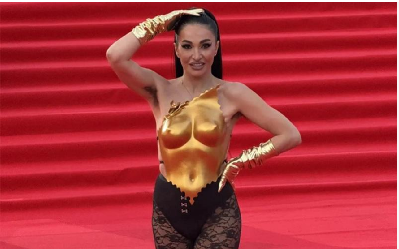
Открытие Московского международного кинофестиваля, 16 апреля 2026 года