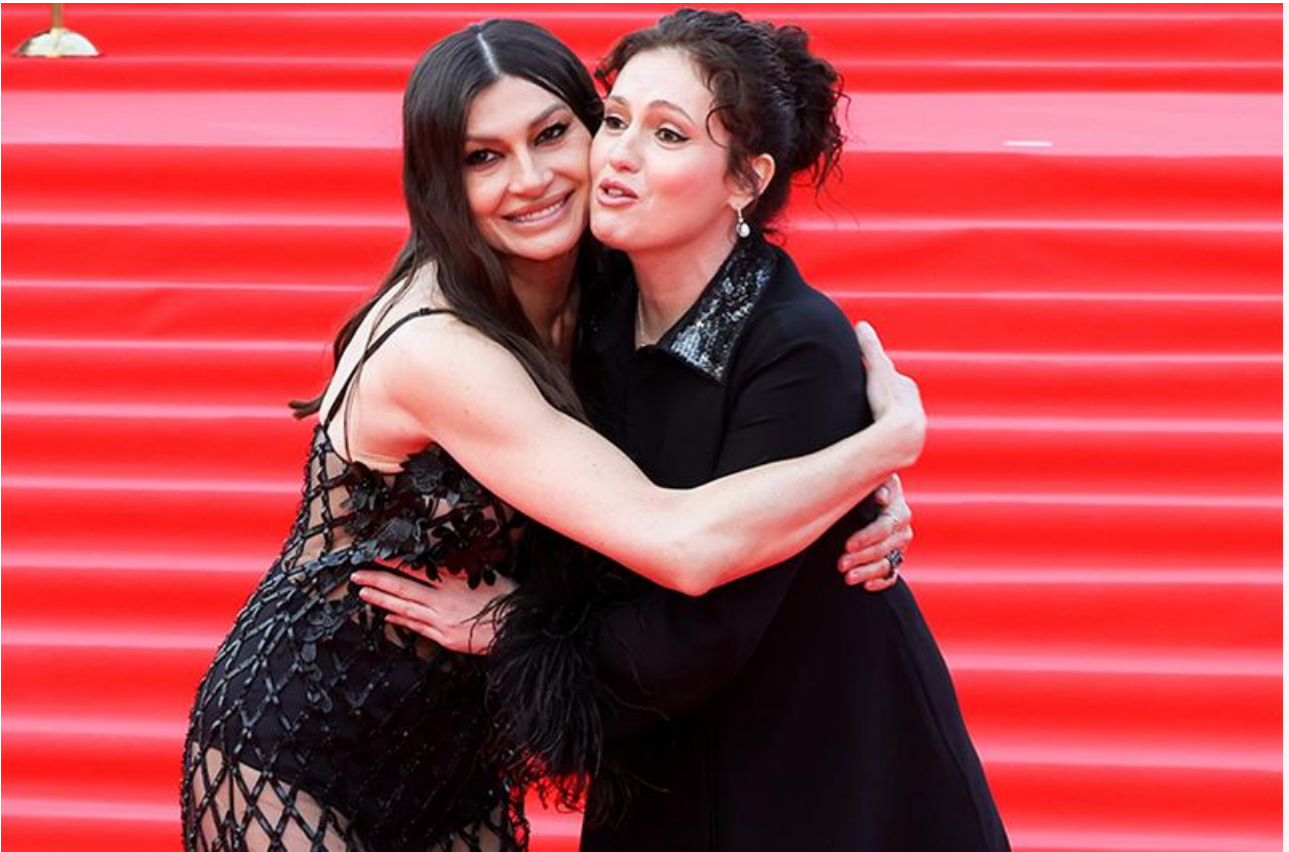
Открытие Московского международного кинофестиваля, 16 апреля 2026 года