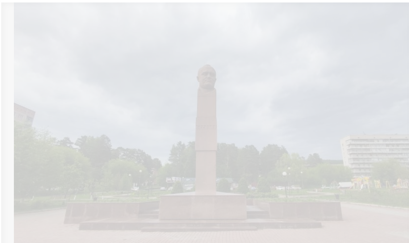
Памятник Королёву в Железногорске

В память о визите одну из улиц Железногорска назвали в честь Королёва, а на одной из городских площадей, которая также носит имя главного конструктора, установили бронзовый памятник, который, со слов сотрудников музея Железногорска, Королёв посетил 2 июля 1960 года.