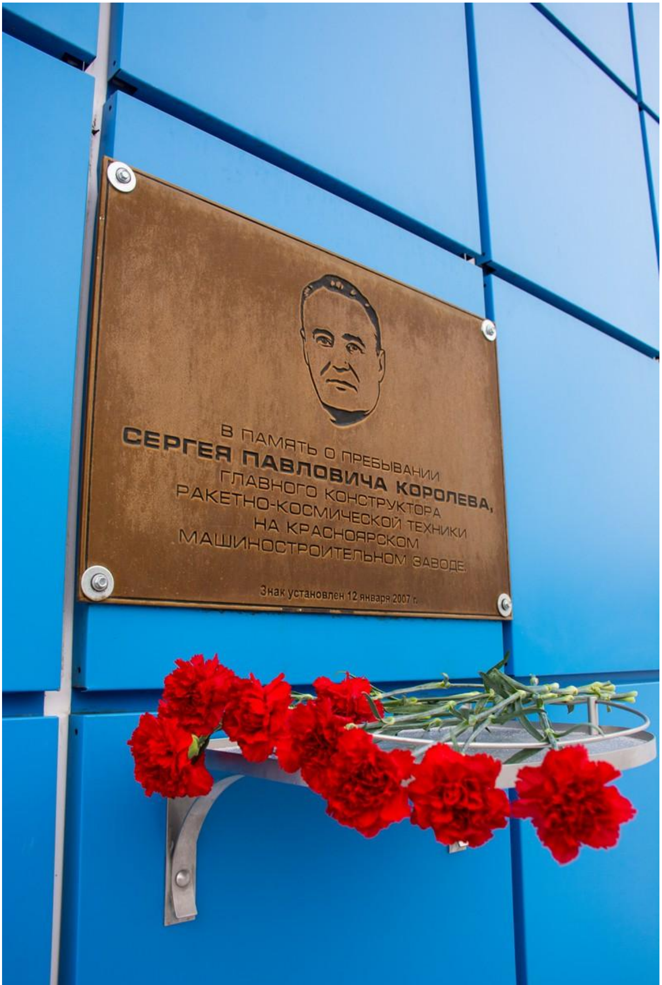
Фото: yandex.com , krsk.kp.ru , krskmz.ru , Игорь Снегирев, АО «Решетнев»

Автор: Анна Роменская © Babr24.com ИСТОРИЯ, НАУКА И ТЕХНОЛОГИИ, ОБЩЕСТВО, КРАСНОЯРСК 17.04.2026, 19:14