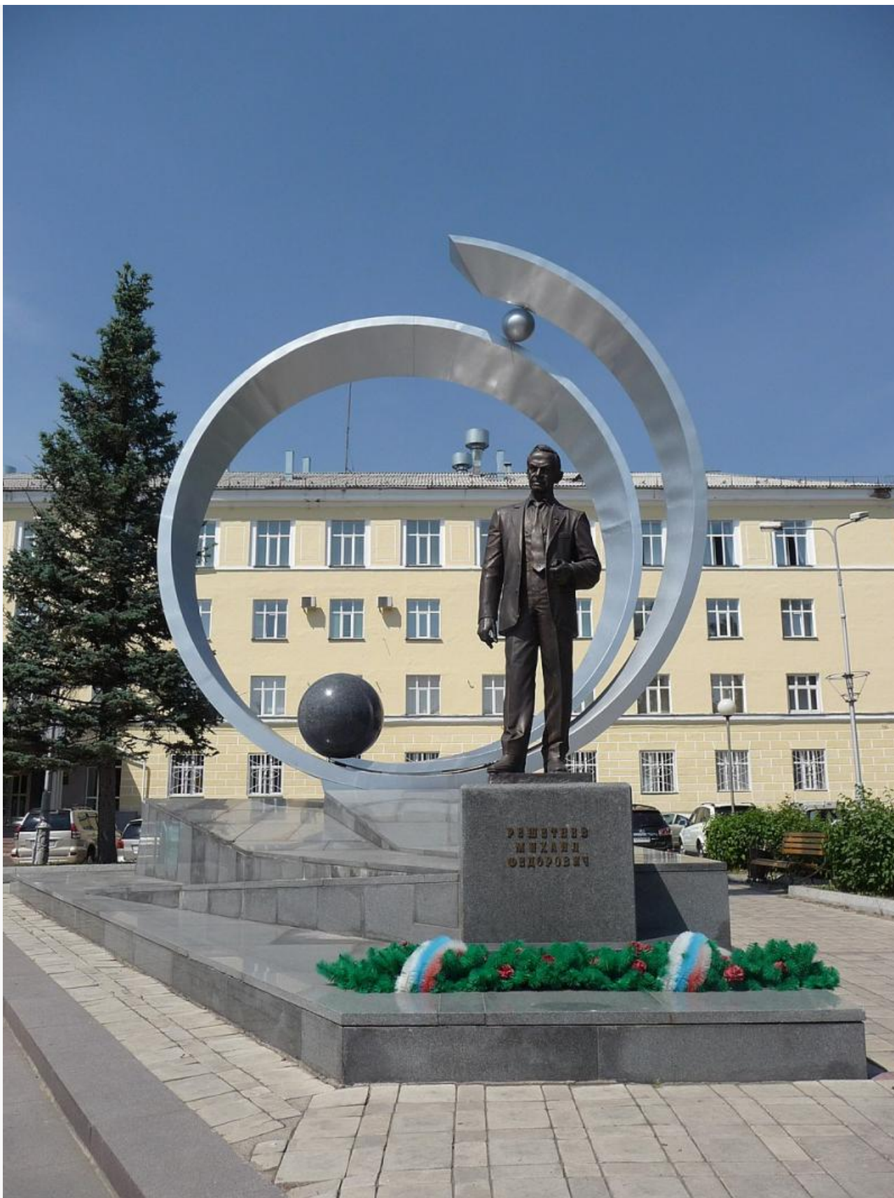
Памятник Михаилу Решетнёву в Железногорске

По воспоминаниям современников, приезд Королёва был связан главным образом «с отвратительно низкими темпами сооружения будущего НПО ПМ ». Осмотрев строительные площадки, возмущённый увиденным Королёв поехал в местный горком КПСС. Об этом рассказывал позднее Михаил Решетнёв, который повсюду сопровождал Королёва.