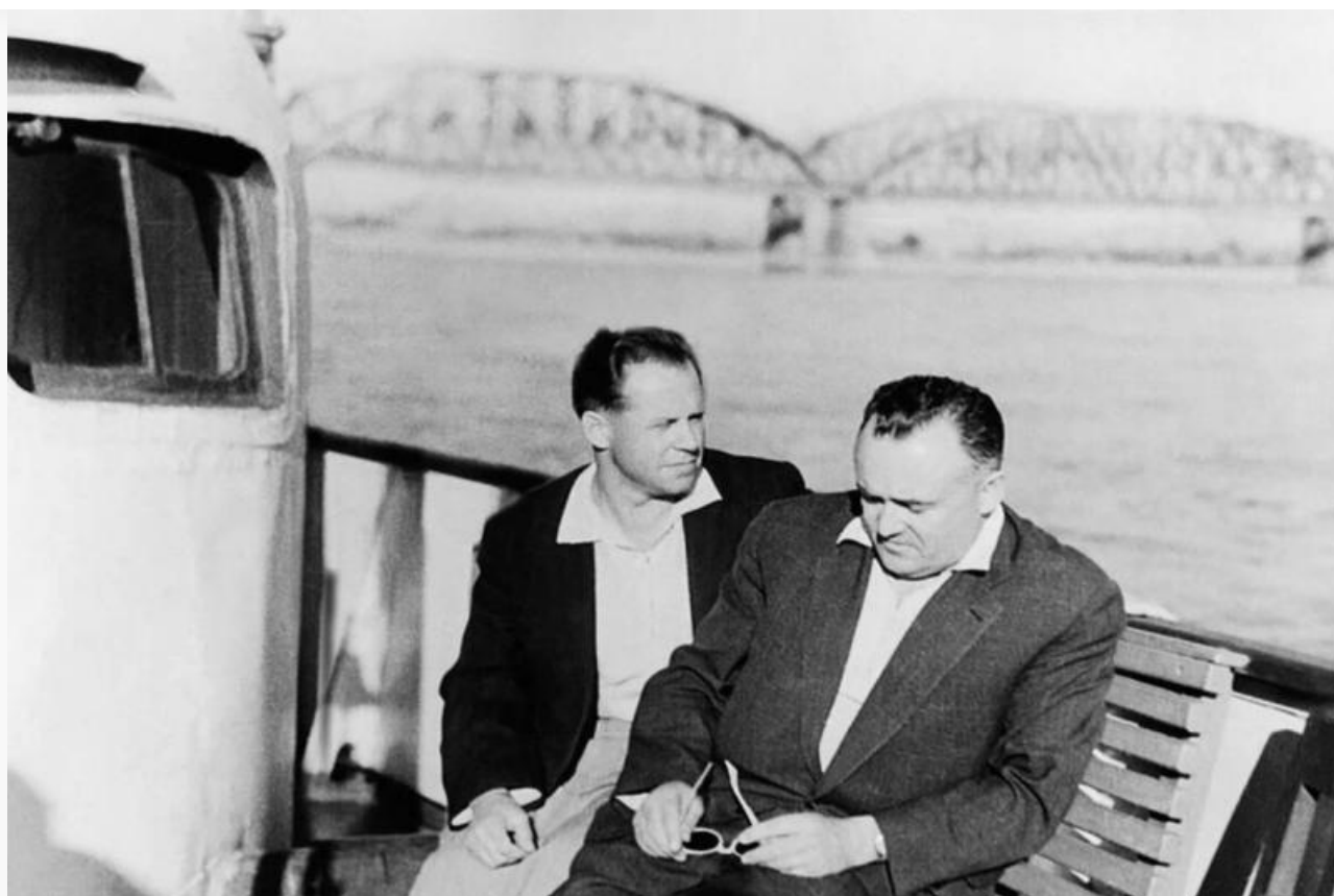
Королёв (справа) в Красноярске