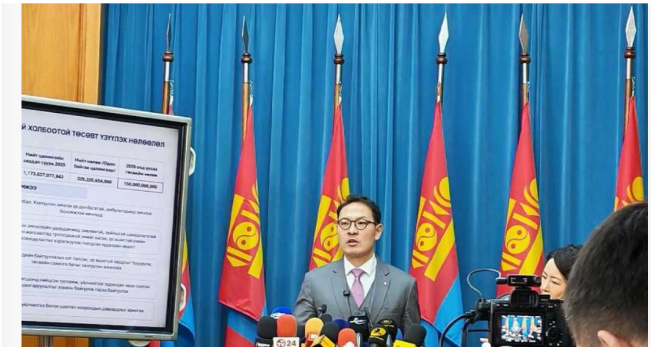
Министр здравоохранения Монголии Е. Батшугар

Существует и другой риск. Повышение зарплат без изменения структуры отраслей может привести к краткосрочному эффекту. Если не будет улучшена эффективность управления и распределения ресурсов, система быстро вернется к прежним проблемам. В здравоохранении этот вопрос уже признан, в образовании он только начинает обсуждаться. Протесты стали поворотной точкой, но не завершением процесса. Сегодня социальная политика в Монголии формируется под давлением общества. Это создает новые возможности, но одновременно требует от власти большей последовательности.