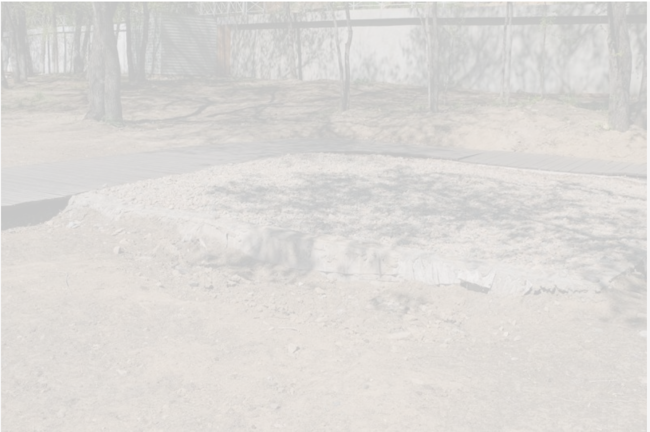
Фото с Мемориала Победы

Тогда Геннадий Бадмаев охотно давал комментарии прессе, что изначально ему предлагались пресловутые 9,1 миллиона рублей, хотя в протоколе значилось целых 30 миллионов. Он отказался подписывать документы и подал жалобу. После её рассмотрения сумма увеличилась до 21,6 миллиона рублей. Очевидно, обычные сельхозпроизводители объективно не способны увеличить размер своей выплаты в два с половиной раза по одному звонку.