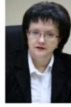
Пастухова Ирина Леонидовна Министр социальной политики