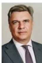
Ермаков Максим Анатолевич Министр промышленности и торговли Красноярского края