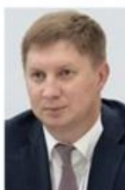
Говорушкин Максим Петрович Министр строительства и жилищно-коммунального хозяйства Красноярского края