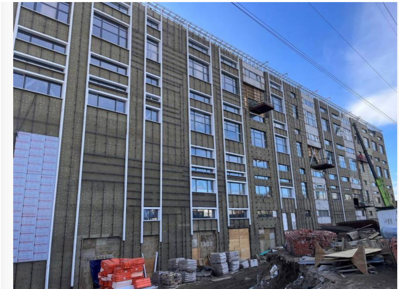
Недостроенное здание Центра креативных индустрий