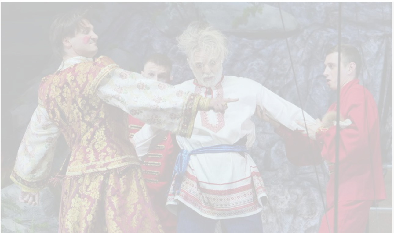
Братья Запашные в шоу БГМЦ «Сказка о Золотой рыбке»

Президент проникся и перед тем, как предоставить слово министру культуры, отметил, что в цирке «много содержательных вещей воспитательного характера», что «малыши ходят туда с удовольствием» и что именно «у малышей закладывается первое представление, что такое Родина, любовь к природе и животным».