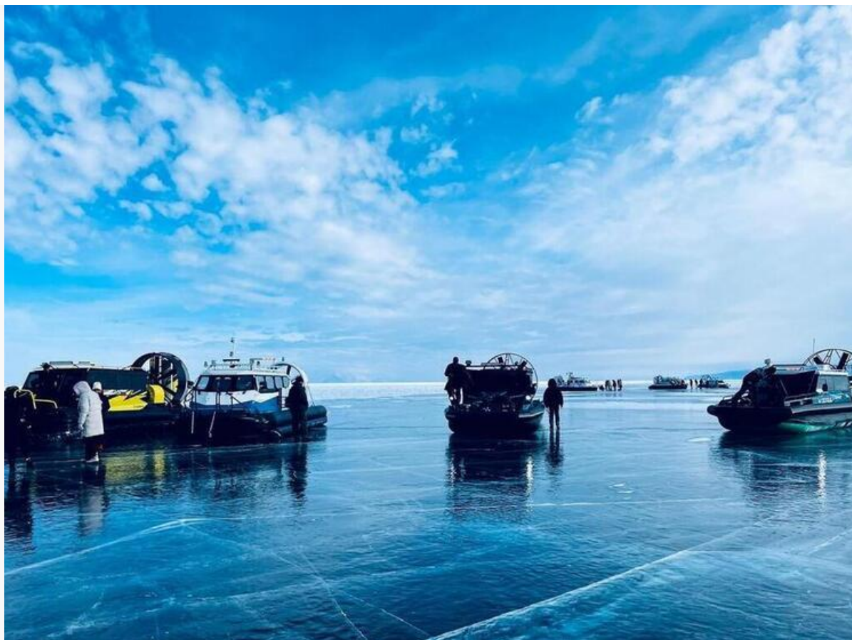
Исследователи БИП СО РАН

Также отметим, что 7 марта исследователи Байкальского института природопользования (БИП СО РАН) при поддержке Российского научного фонда закончили мониторинг популярного маршрута от посёлка Турка до острова Ольхон. Турка выступает центральным кластером «Байкальской гавани». Объектом изучения стали пятнадцатичасовые однодневные туры на судах на воздушной подушке (СВП). На точке «Середина Байкала» исследователи обнаружили плотные скопления пищевых отходов. Локация славится идеально прозрачным льдом. Коммерсанты используют её для массовых фотосессий и катания на коньках, но забывают вывозить мусор.