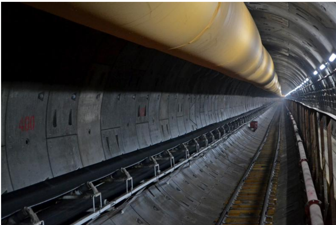
Фото: t.me/Sib_Express , del.ru

Автор: Кирилл Богданович © Babr24.com Источник: https://t.me/Sib_Express КОРПОРАЦИИ, СКАНДАЛЫ, ТРАНСПОРТ, КРАСНОЯРСК 👁 37 02.04.2026, 19:20