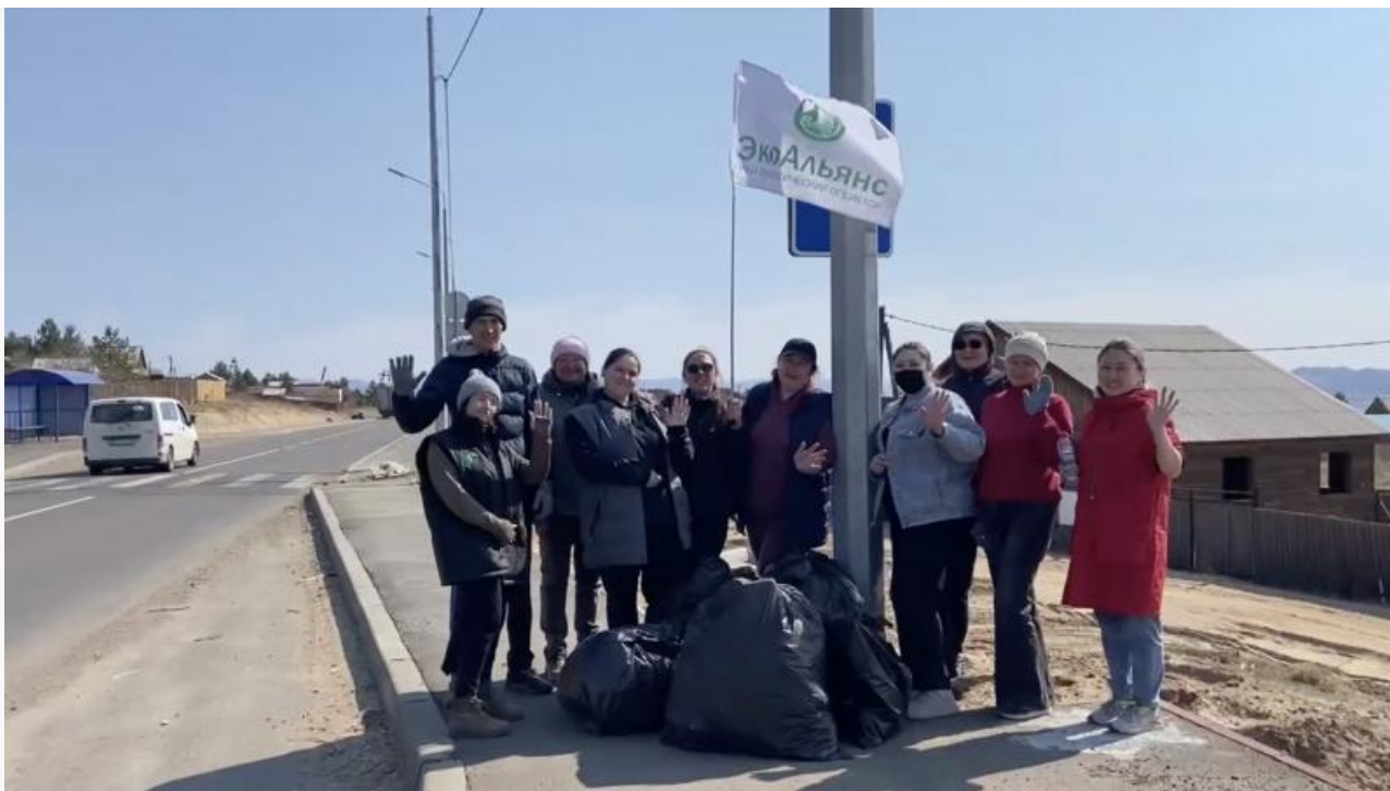
Коллектив «ЭкоАльянса» на субботнике в мае 2025- го

С приходом весны жители Улан-Удэ начали жаловаться на захламление новых территорий. На улице Сахьяновой, например, отходы уже не помещаются в контейнеры, мешки и их содержимое валяются рядом с домами и даже возле буддийского центра. В СМИ прозвали это место мусорной долиной. Местные жители заявляют, что летом здесь они буквально стараются не дышать.