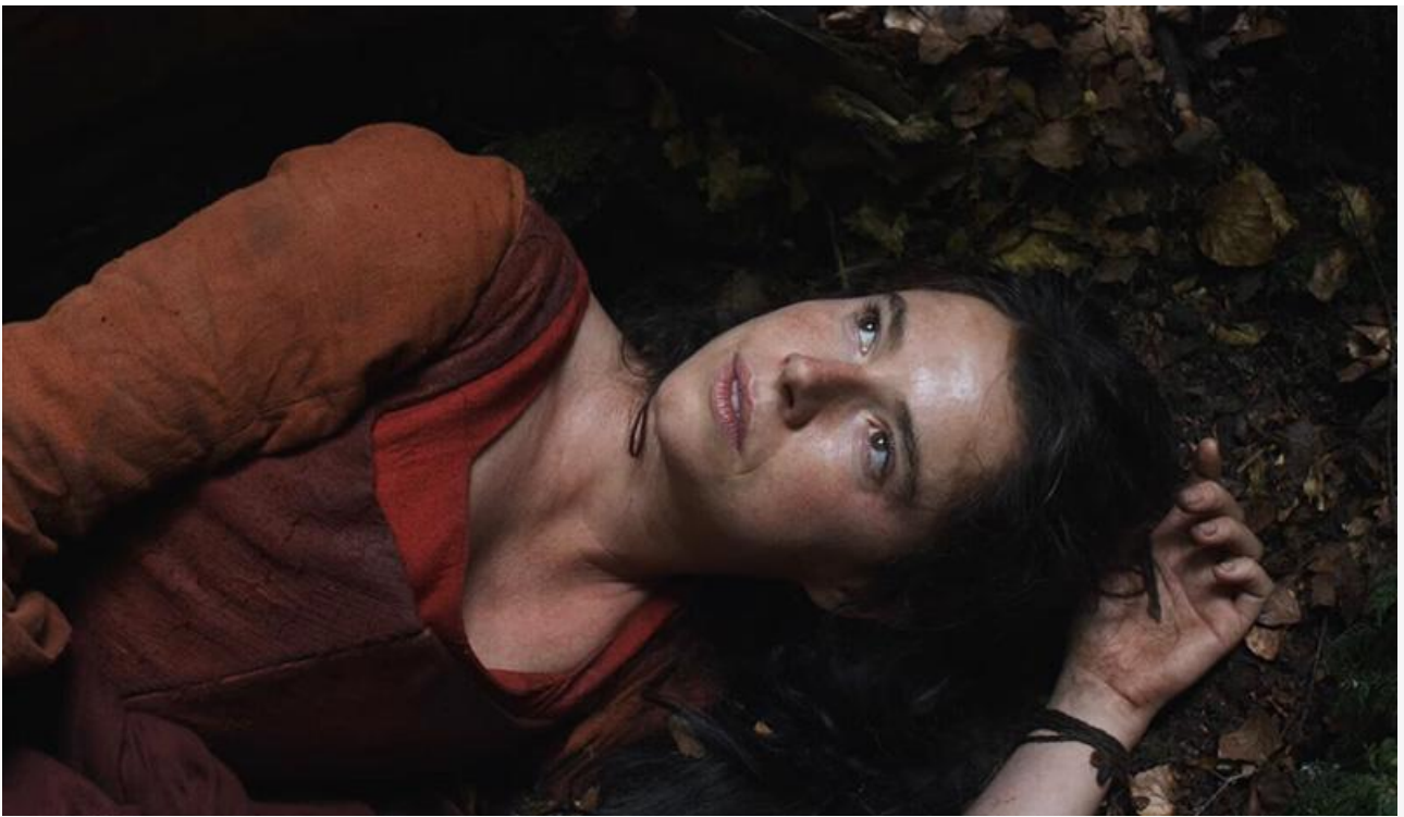
Джесси Бакли в фильме «Хамнет: История, вдохновившая „Гамлета“»