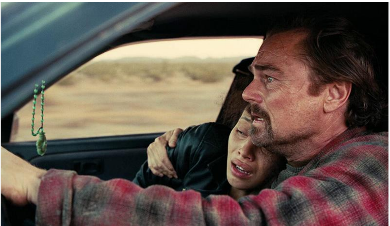
Кадр из фильма «Битва за битвой»

Триумфатором премии стала «Битва за битвой», получившая шесть «масок», в том числе и за лучший фильм. «Хамнет: История, вдохновившая „Гамлета“», ставший лучшим драматическим фильмом на «Золотом глобусе», на этот раз довольствовался «утешительным» призом в категории «Лучший британский фильм», «Сентиментальная ценность» – премией лучшему неанглоязычному фильму, а вот «Марти Великолепный» неожиданно уехал с церемонии с пустыми руками, оставшись без наград.