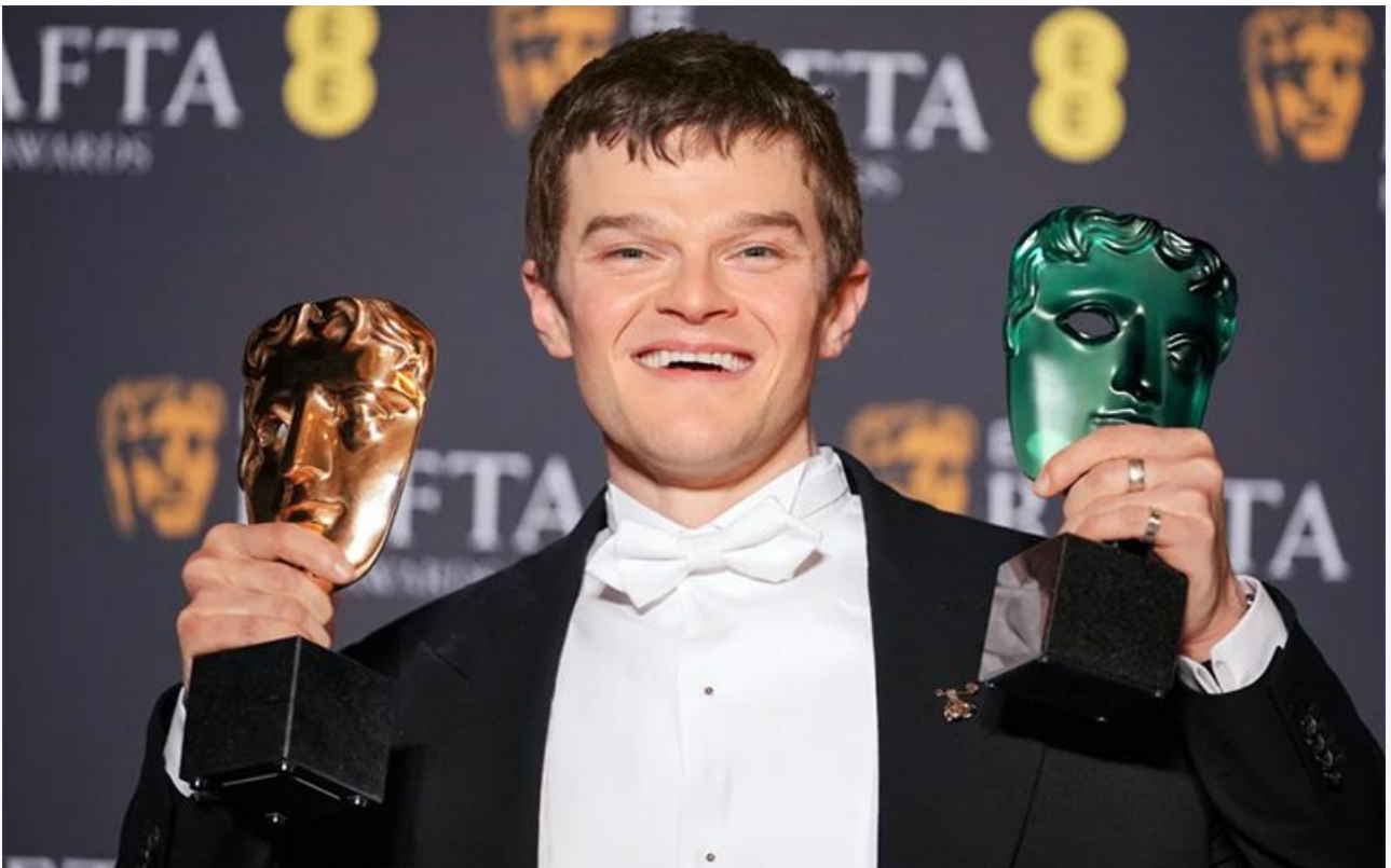
Роберт Арамайо с премиями BAFTA

Лучшую женскую роль, по версии британских академиков, сыграла в минувшем году Джесси Бакли , воплотившая в исторической драме «Хамнет: История, вдохновившая „Гамлета“» образ Агнес Шекспир. В конкурентках у неё были Эмма Стоун («Бугония»), Роуз Бирн («Я бы тебя пнула, если бы могла»), Чейз Инфинити («Битва за битвой»), Кейт Хадсон («Мелодия их мечты») и Ренате Реинсве («Сентиментальная ценность»).