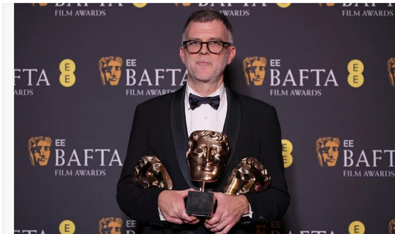
Пол Томас Андерсон с премиями BAFTA