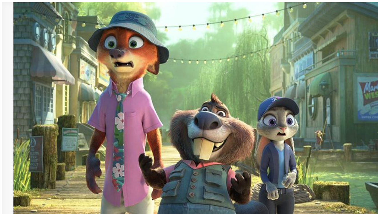
Кадр из фильма «Зверополис 2»

Лучшим анимационным фильмом британские академики признали «Зверополис 2» от Walt Disney Animation Studios. Среди номинантов также были «Элио» и «Маленькая Амели».