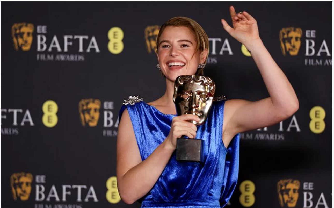
Джесси Бакли с премией BAFTA

«Аватар: Пламя и пепел» Джеймса Кэмерона был выдвинут на премию лишь в одной категории – «Лучшие визуальные эффекты», – где и стал победителем.