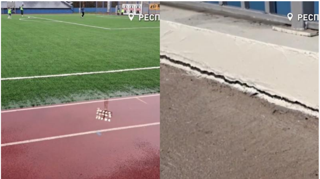
Кадры активистов ОНФ в октябре 2025 года

По данным источников, знакомых с ходом проверки, внимание силовиков привлекли обстоятельства самих торгов. Компания «Энергострой» (ОГРН 1190327008960) выиграла тендер, предложив цену почти на 90 миллионов рублей ниже конкурентов. Подрядчик выиграл торги и отправил бумаги в государственную экспертизу. После согласований чиновники увеличили сумму контракта на 412 миллионов рублей. Итоговая цена с учётом тендерного коэффициента перевалила за 569 миллионов. При этом объём работ в первоначальном техническом задании не изменился.