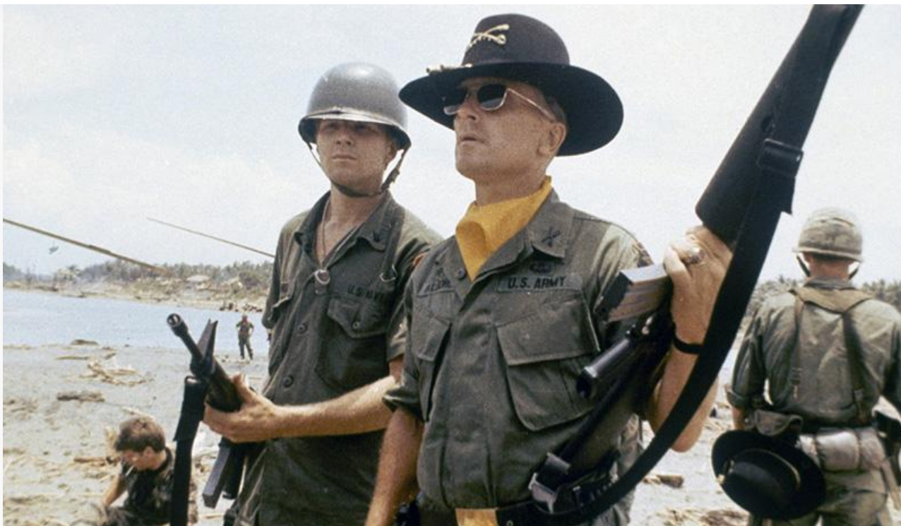
Билл Килгор в фильме «Апокалипсис сегодня», 1979 год. Номинация на «Оскар» и премии BAFTA и «Золотой глобус» в категории «Лучшая мужская роль второго плана»