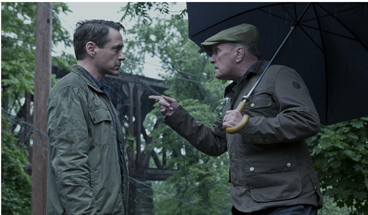
Джозеф Палмер в фильме «Судья», 2014 год. Номинации на премии «Оскар», «Золотой глобус» и Гильдии киноактёров США в категории «Лучшая мужская роль второго плана»