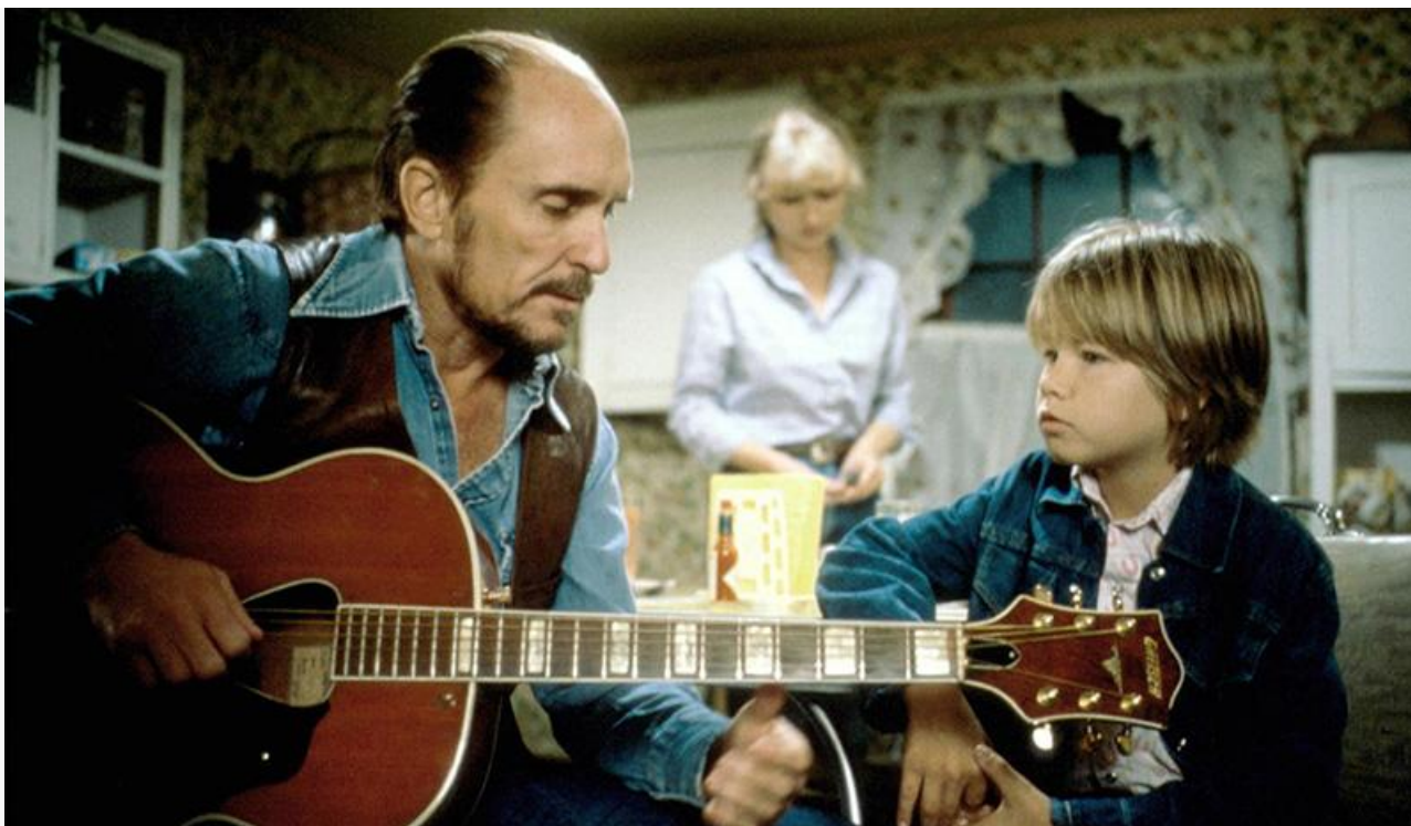
Мак Следж в фильме «Нежное милосердие», 1983 год. Премии «Оскар» и «Золотой глобус» в категории «Лучшая мужская роль»