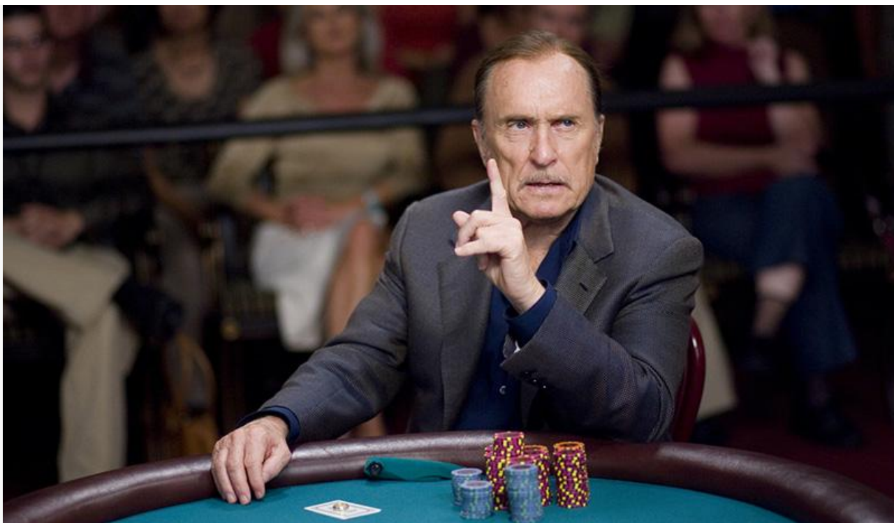
Эл Си Чивер в фильме «Везунчик», 2007 год