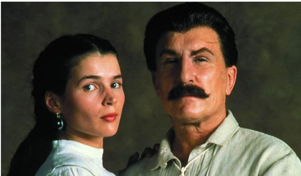
Иосиф Сталин в фильме «Сталин», 1992 год. Номинация на премию «Эмми» и премия «Золотой глобус» в категории «Лучший актёр на телевидении»