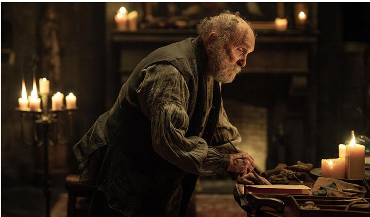
Жан Пепе в фильме «Всевидающее око». Последняя роль в кино, 2022 год