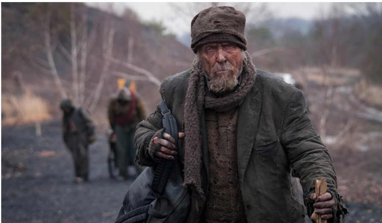
Старик в фильме «Дорога», 2009 год