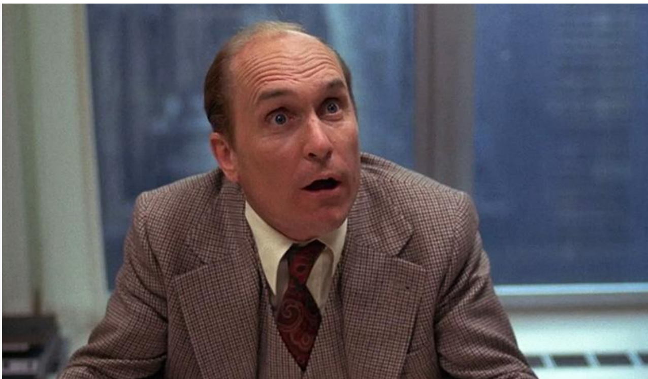
Фрэнк Хэкетт в фильме «Телесеть», 1976 год. Номинация на премию BAFTA в категории «Лучшая мужская роль второго плана»