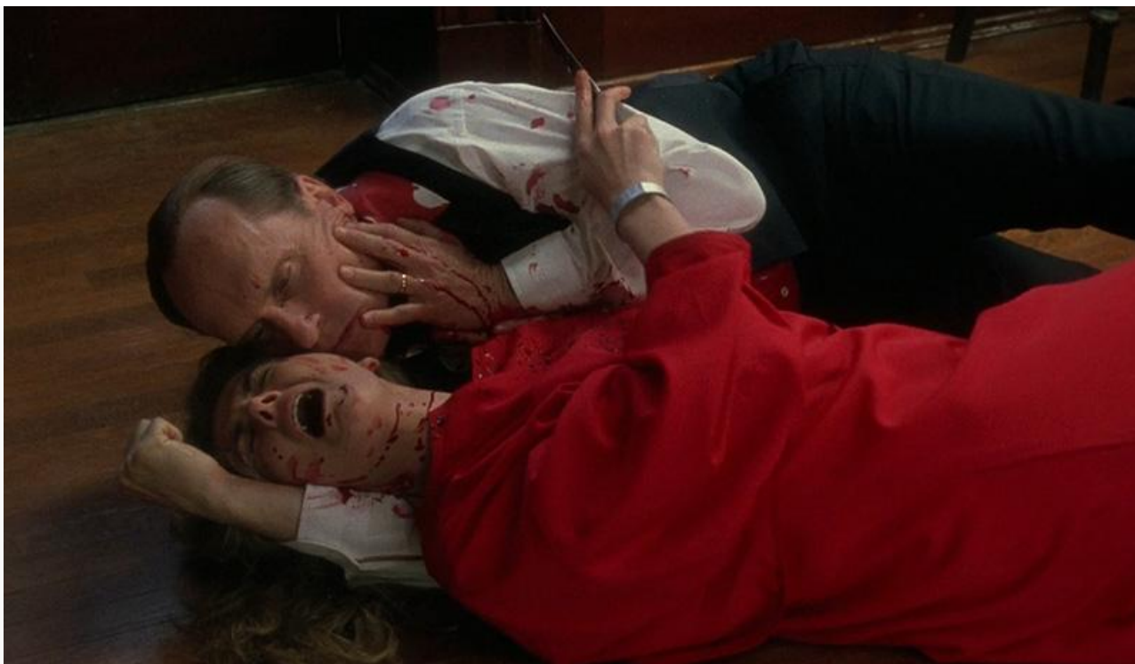
Командир в фильме «Рассказ служанки», 1989 год