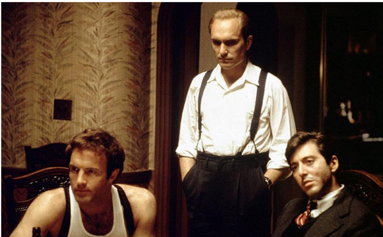
Том Хаген в фильме «Крёстный отец», 1972 год. Номинации на премии «Оскар» и BAFTA в категории «Лучшая мужская роль второго плана»