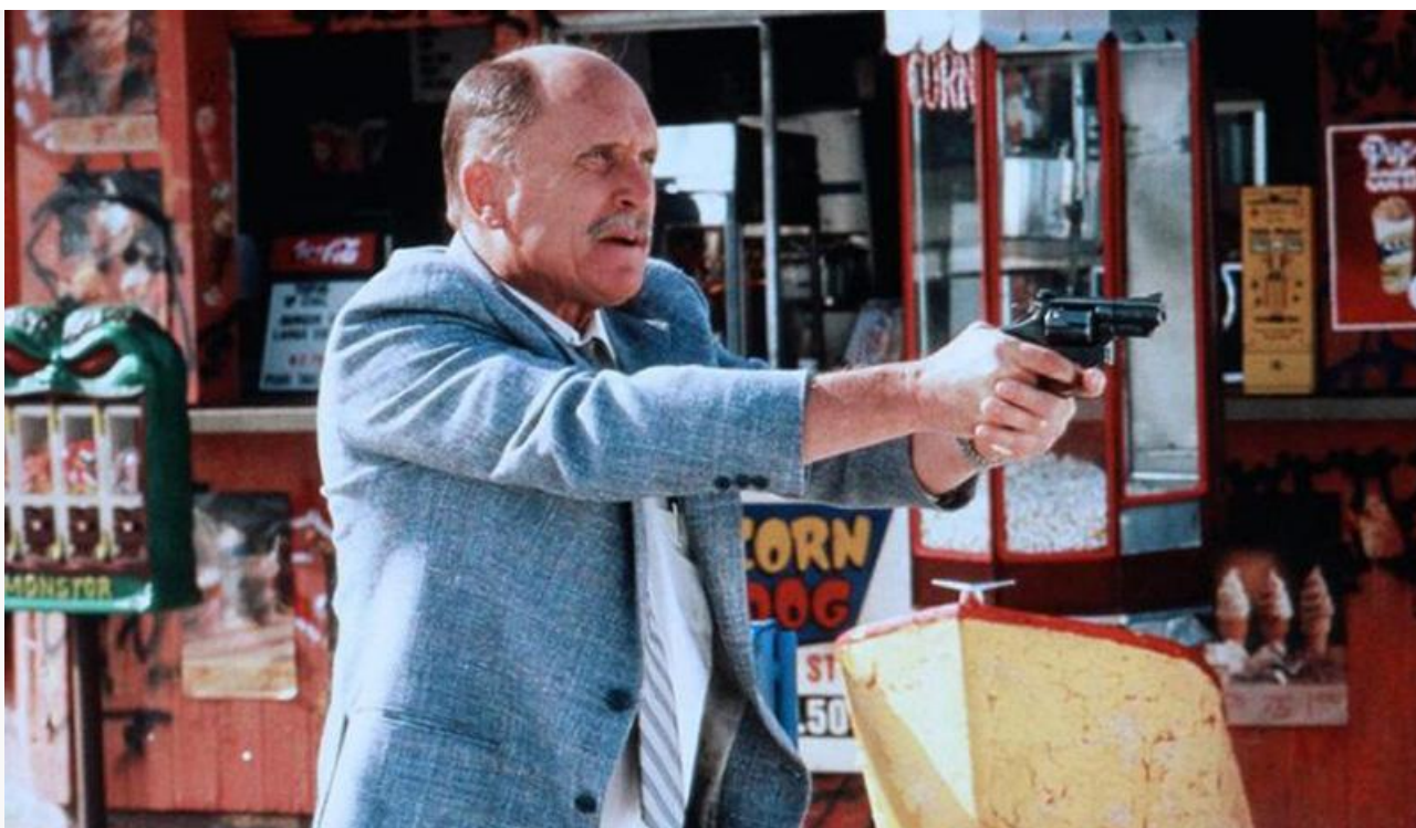
Мартин Пендергаст в фильме «С меня хватит!», 1992 год