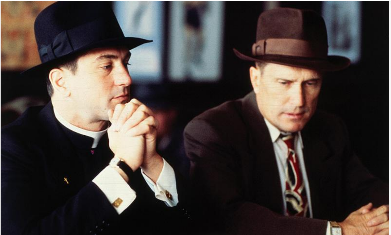
Том Селласи в фильме «Тайны исповеди», 1981 год. Премия Пазинетти за лучшую мужскую роль Венецианского кинофестиваля

В 1992 году Роберт Дювалл сыграл главную роль в биографическом телефильме Ивана Пассера для канала НВО «Сталин» и был удостоен за эту работу четвёртым в карьере «Золотым глобусом».