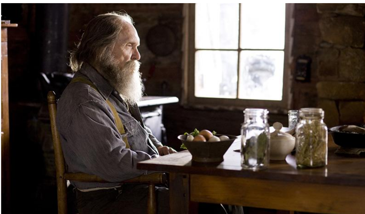
Феликс Буш в фильме «Похороните меня заживо», 2009 год. Номинация на Премии «Спутник» и Гильдии киноактёров США в категории «Лучшая мужская роль»