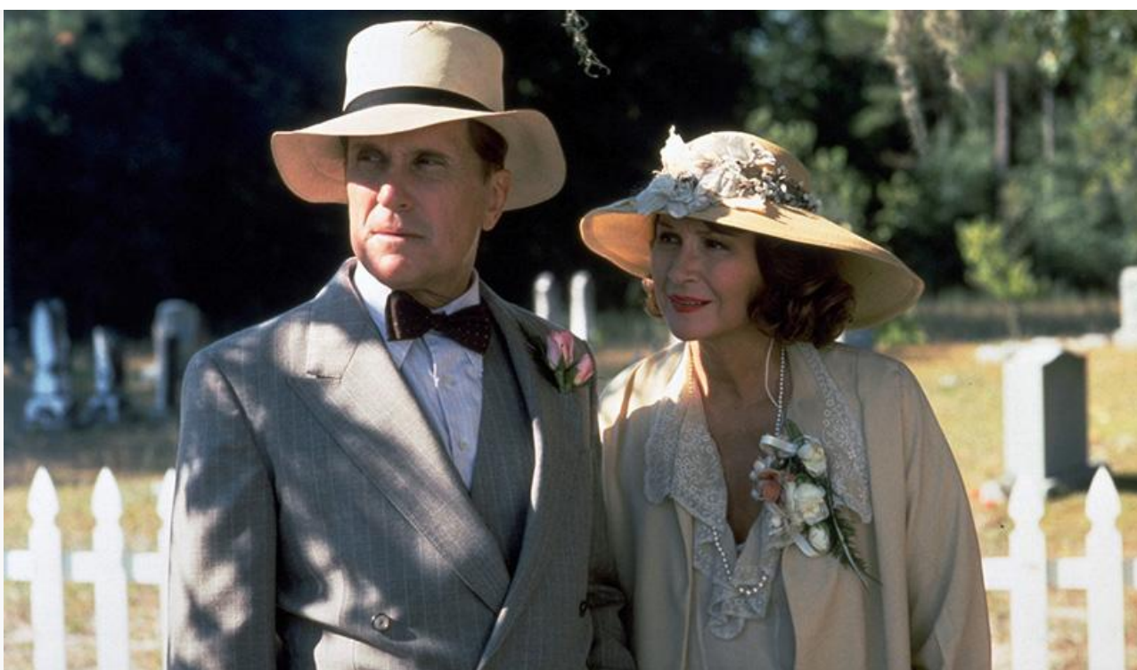
Дэдди Хиллер в фильме «Беспутная Роза», 1991 год