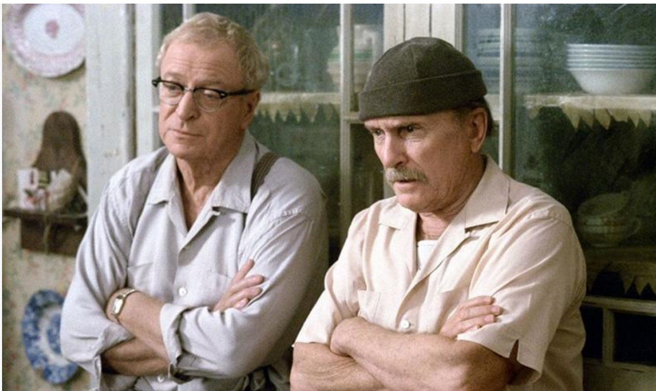
Хаб в фильме «Поддержанные львы», 2003 год