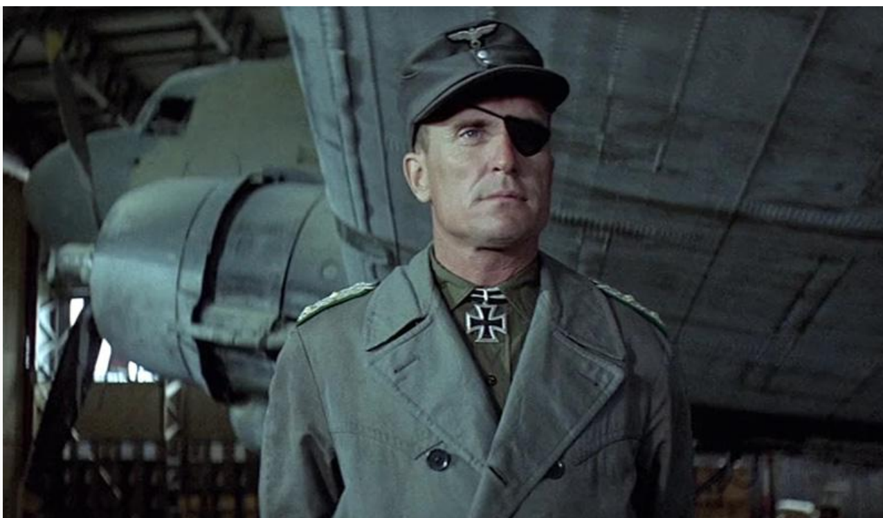
Макс Редл в фильме «Орёл приземлился», 1976 год