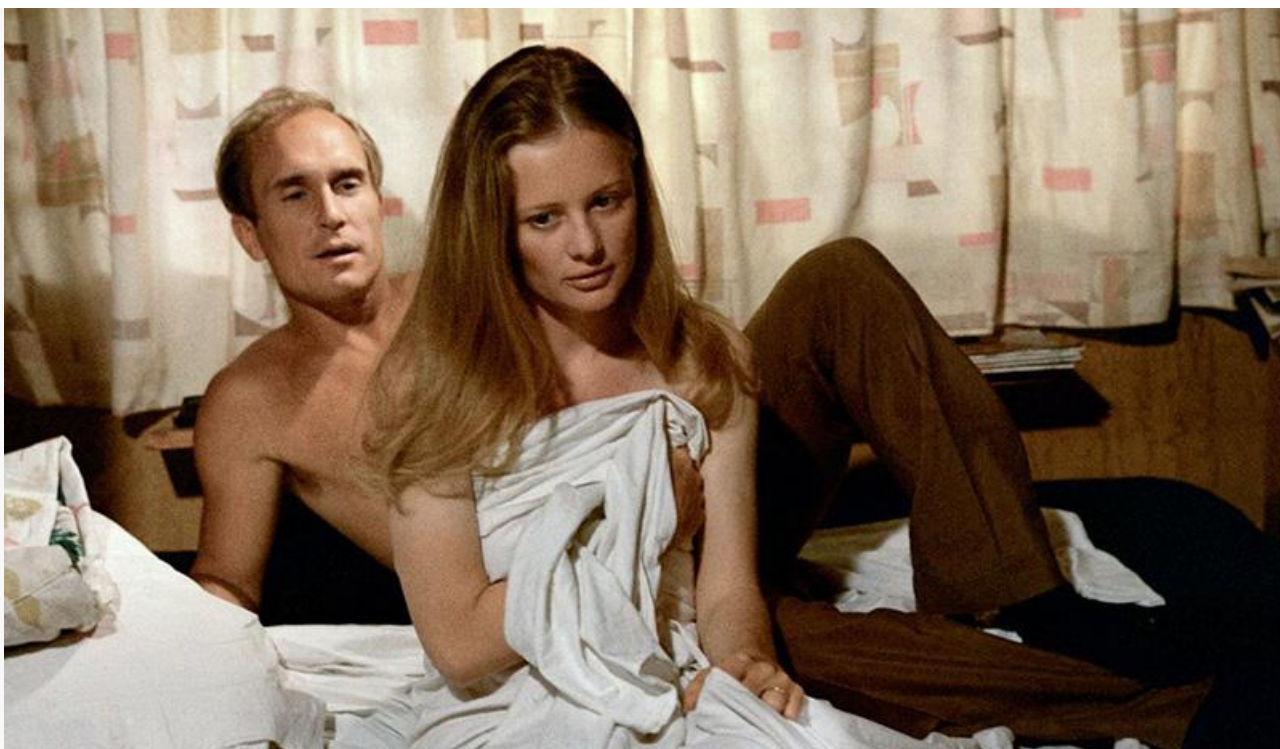
Гордон в фильме «Люди дождя», 1969 год