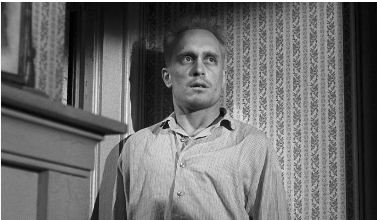
Артур Рэдли в фильме «Убить пересмешника», 1962 год