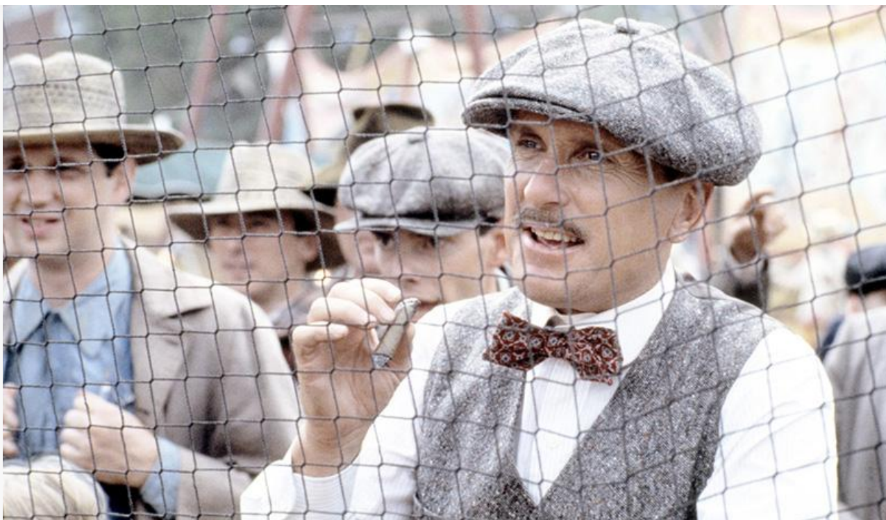
Макс Мерси в фильме «Самородок», 1984 год