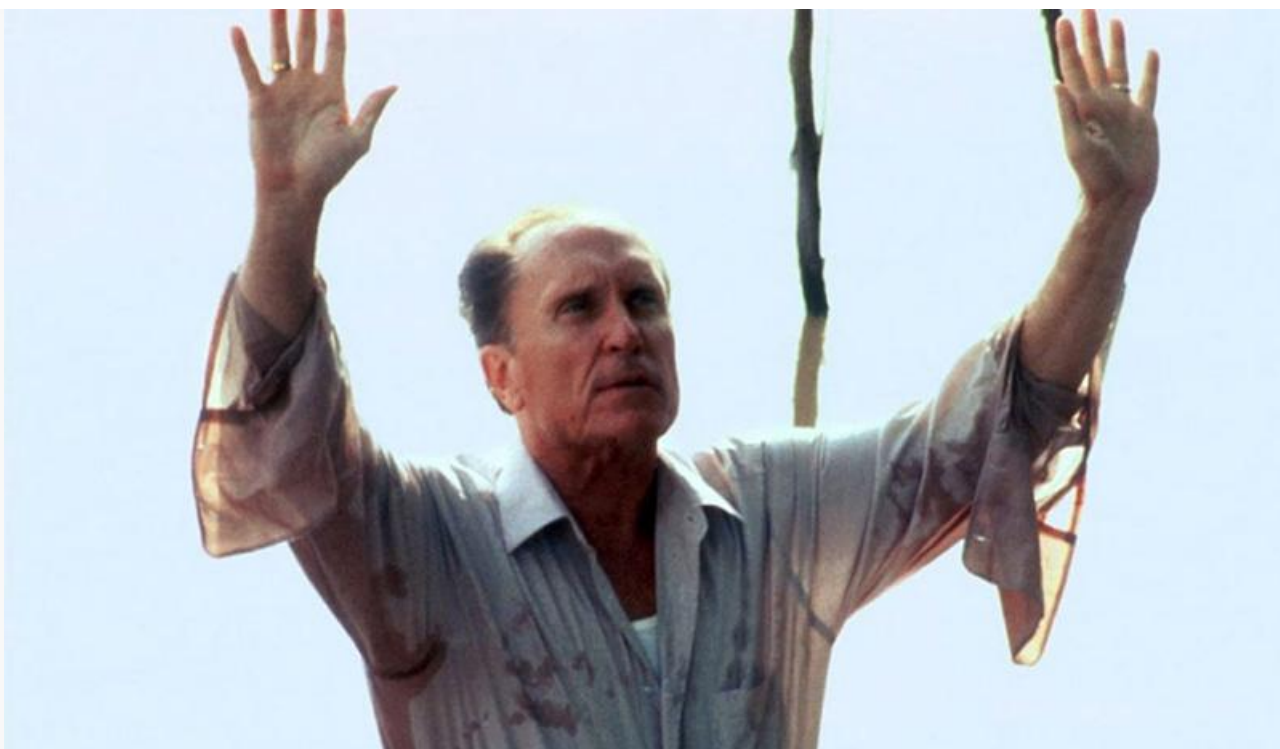
Улисс Дьюи в фильме «Апостол», 1997 год. Номинации на премии «Оскар» и Гильдии киноактёров США и премия «Спутник» в категории «Лучшая мужская роль»