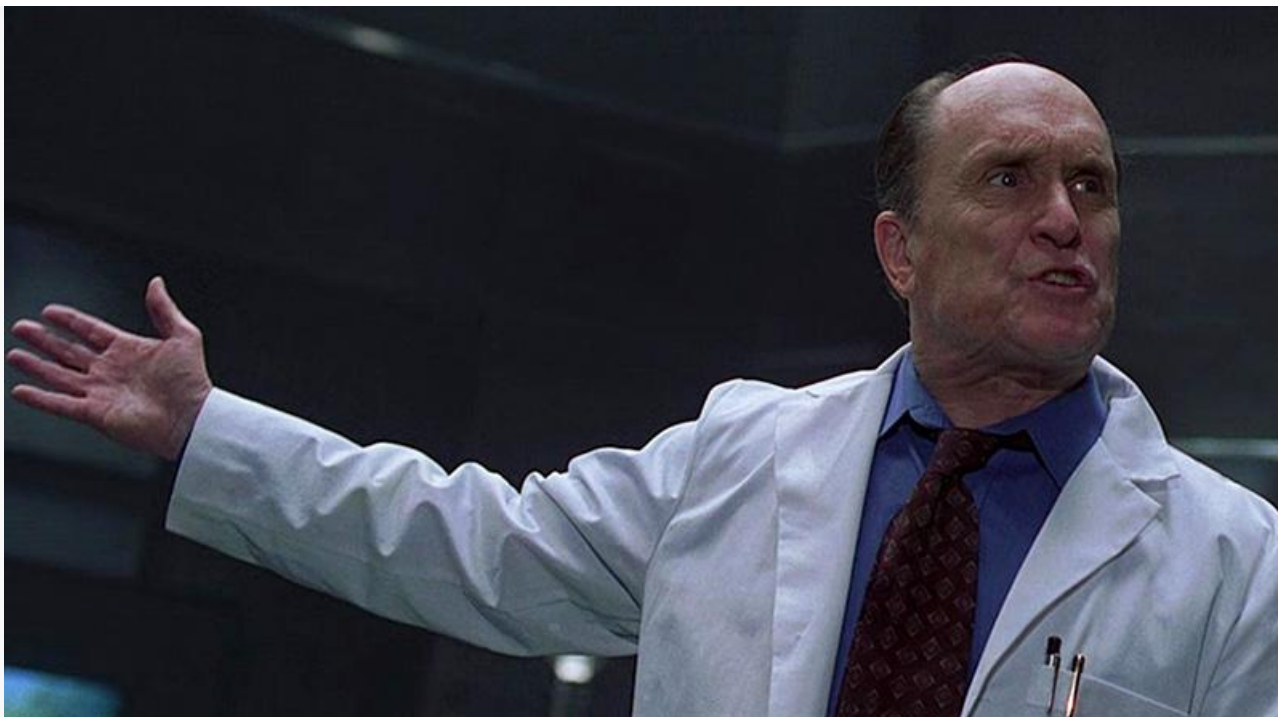
Доктор Гриффин Виэр в фильме «Шестой день», 2000 год

В XXI столетии легенду кинематографа можно было увидеть в фильмах «Угнать за 60 секунд» Доминика Сены, «Джон Кью» Ника Кассаветиса, «Хозяева ночи» Джеймса Грея, «Сумасшедшее сердце» Скотта Купера, «Дорога» Джона Хиллкоута, «Джек Ричер» Кристофера Маккуорри, «Судья» Дэвида Добкина и многих других.