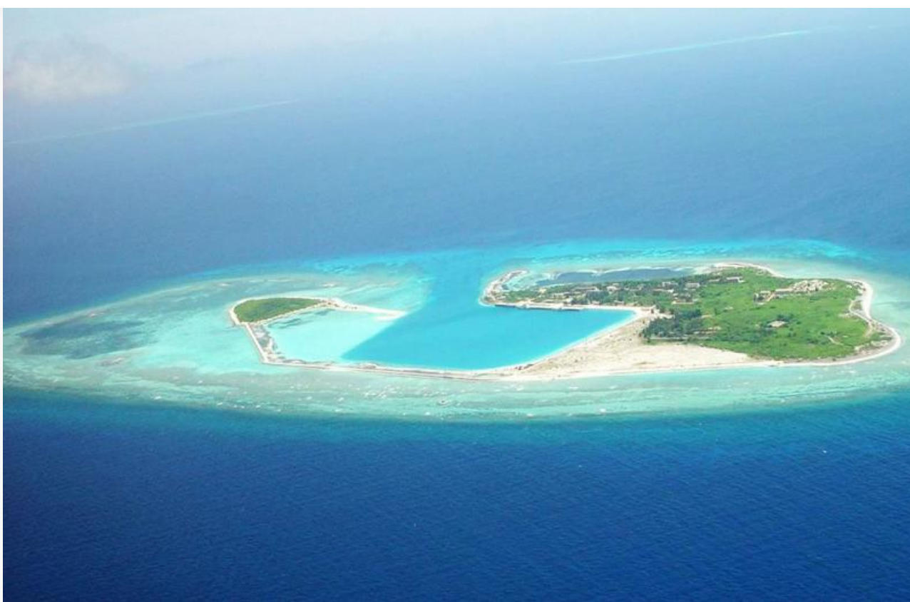
Отмель Скарборо с высоты птичьего полета

По версии филиппинских служб безопасности, полеты задержанного могли использоваться не только в учебных целях. Следствие изучает данные видеонаблюдения и цифровых носителей. Есть мнение, что во время одиночных полетов монгольским пилотом велась аэрофотосъемка аэропорта Иба и прилегающего района. Эта территория считается ближайшей филиппинской точкой к спорному рифу.