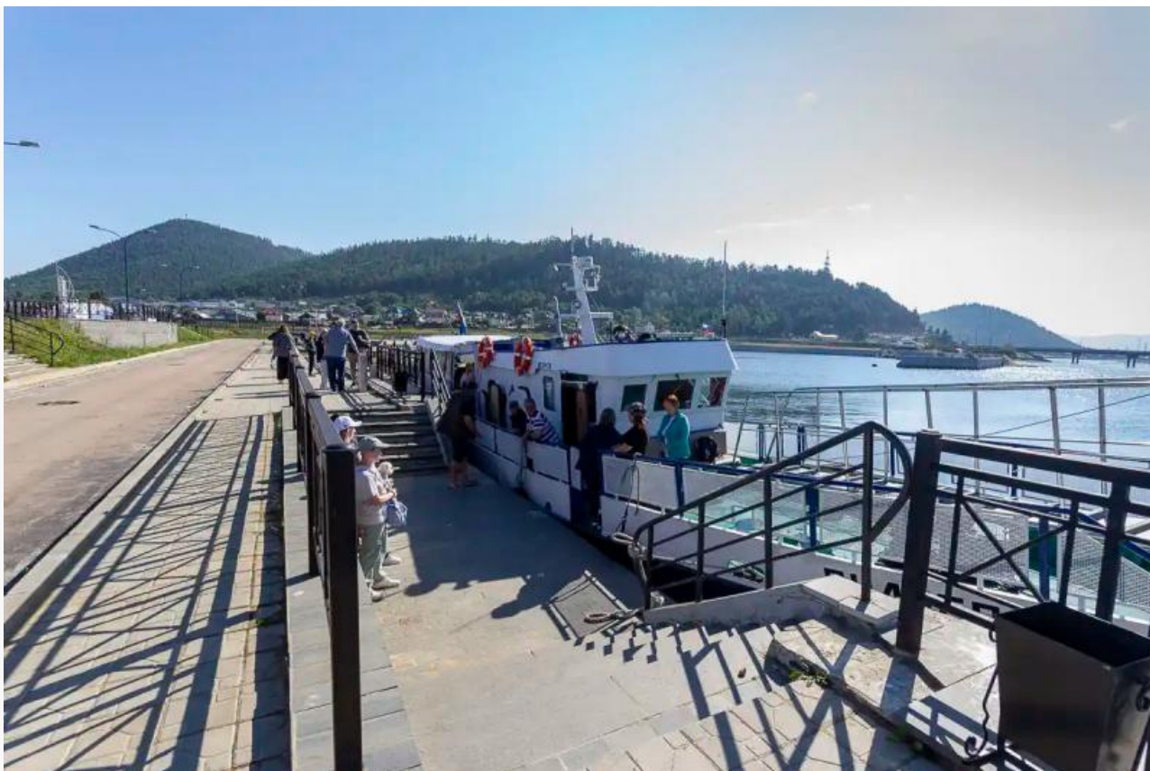
Фото с сайта экскурсий из Турки к Ольхону на катере