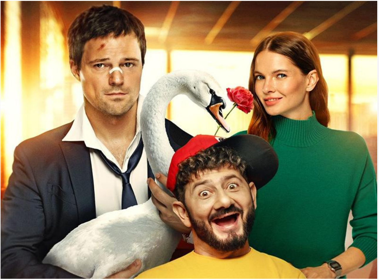
Постер к фильму «Уволить Жору»

Видео дня. Первая, сильная, слепая, обжигающая