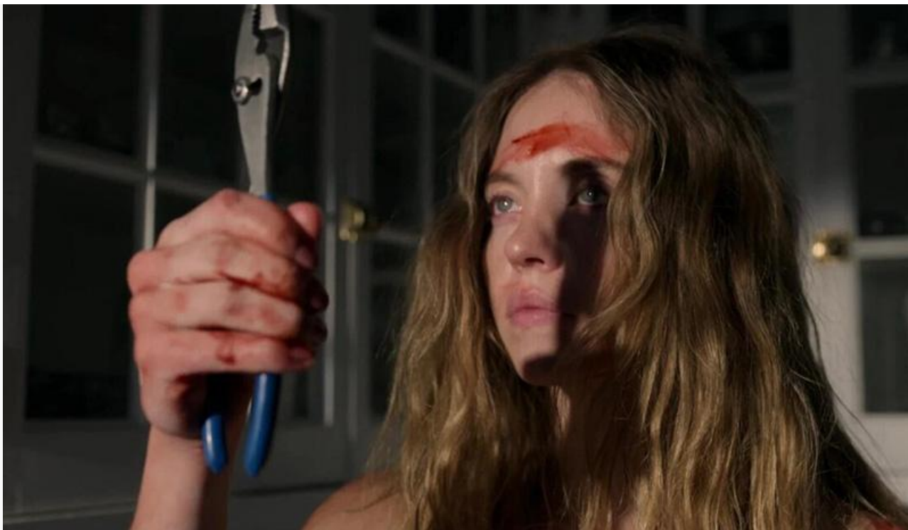
Сидни Суини в фильме «Горничная»

Также сохранили места в топовой десятке «Чебурашка 2» (75,2 миллиона с потерей в сборах 32 % и третье место), «Мартин Великолепный» (36,6 миллиона с потерей в сборах 20 % и четвертое место), «Левша» (33,4 миллиона с потерей в сборах 46 % и шестое место), «Возвращение в Сайлент Хилл» (30,8 миллиона с потерей в сборах 57 % и седьмое место) и «Комментируй это» (19 миллионов с потерей в сборах 65 % и десятое место).