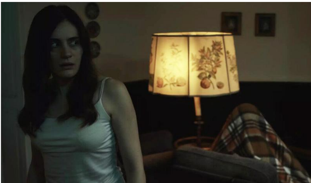
Кадр из фильма «Верни меня из мёртвых»