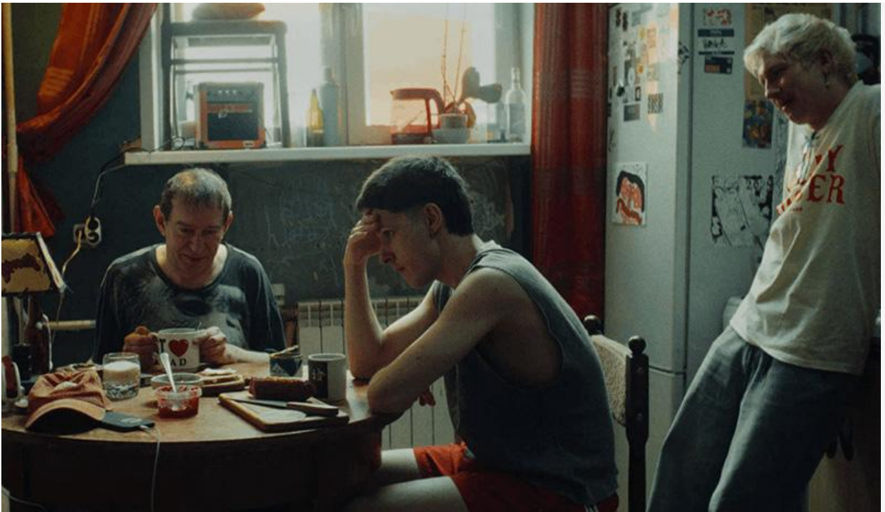
Кадр из фильма «Здесь был Юра»

Лидерство в прокате, потеряв в сборах по сравнению с предыдущими выходными 22 %, ожидаемо сохранила «Горничная» , пополнившая копилку на 157 миллионов рублей при средней посещаемости 26 зрителей за сеанс. На минувшей неделе триллер Пола Фига официально вступил в «Клуб миллиардеров» российского проката 2026 года, где его удивлённо встретили местные «Чебурашка 2» , «Простоквашино» и «Буратино» .