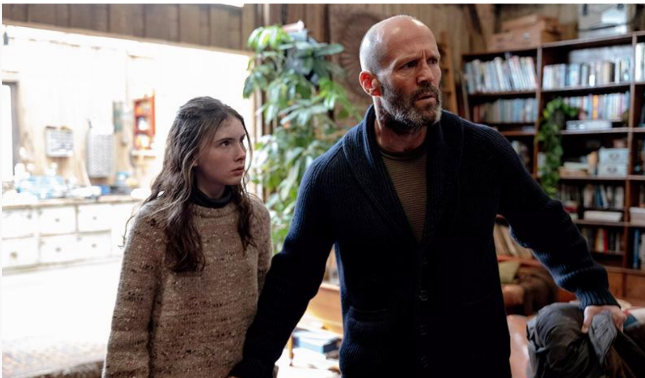
Кадр из фильма «Убежище»

По данным портала Kinobusiness.com и ЕАИС, лучшей новинкой уикенда с суммой 95,1 миллиона, собранной на 1 415 экранах за 12 тысяч сеансов, стал боевик Рика Романа Во «Убежище» с Джейсоном Стэйтемом в главной роли. Средняя посещаемость экшн-триллера, встретившего утро первого понедельника в России на второй строке чарта, составила 14 зрителей за сеанс.