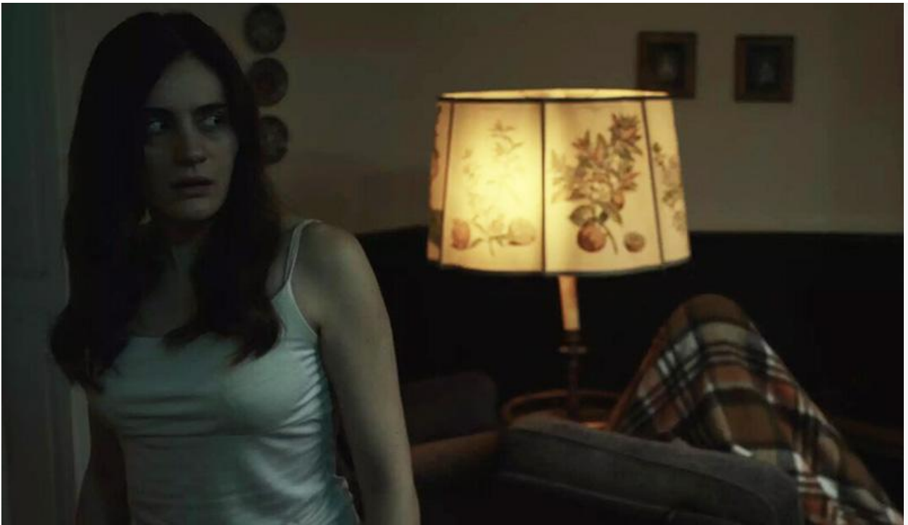
Кадр из фильма «Верни меня из мёртвых»