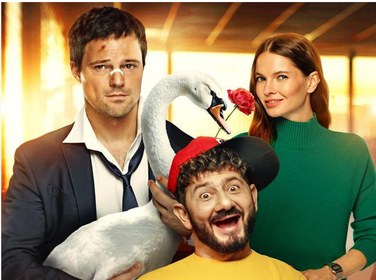
Постер к фильму «Уволить Жору»

Видео дня. Первая, сильная, слепая, обжигающая