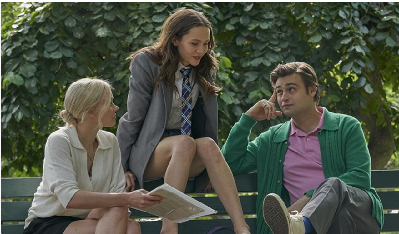
Кадр из фильма «Виновата любовь»

Венецианского кинофестиваля. Фильм получил премии «Гойя» и «Сатурн» в категории «Лучший фильм», а исполнительница главной роли Николь Кидман была номинирована на премии BAFTA и «Золотой глобус» и удостоена премии «Сатурн» в категории «Лучшая женская роль».