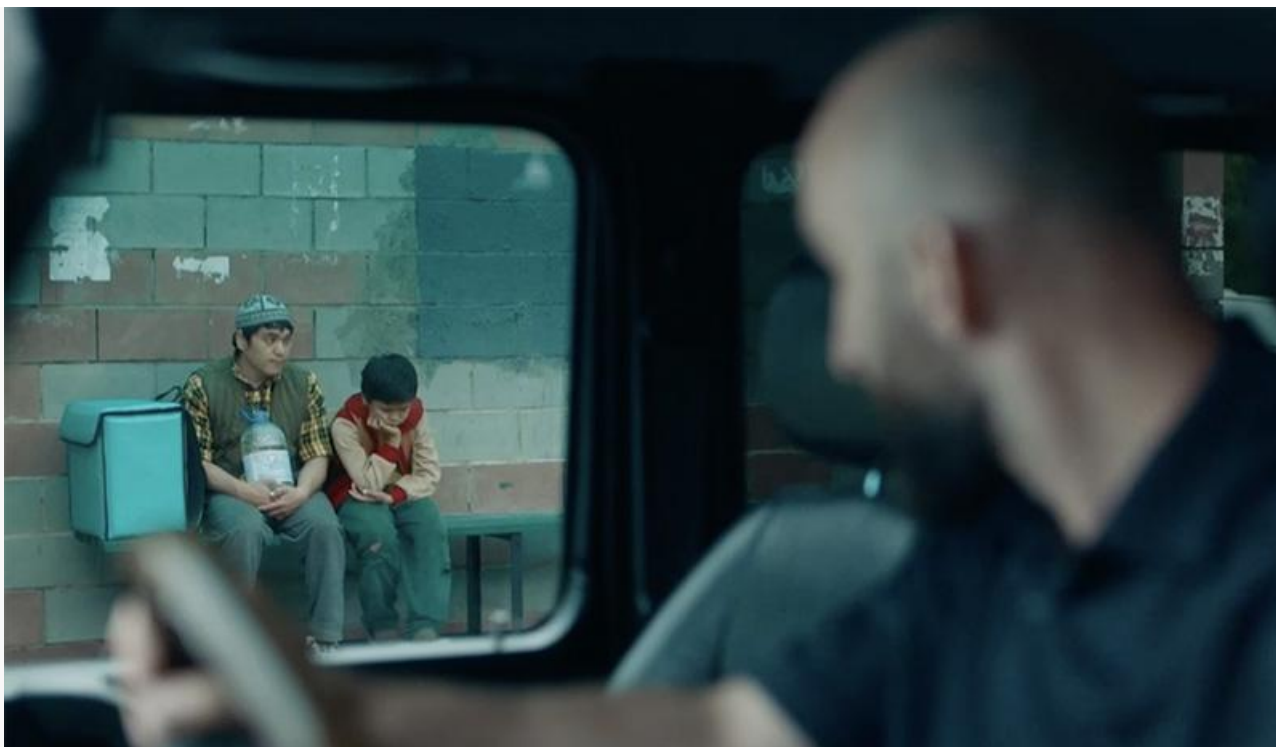
Кадр из фильма «Рай под ногами матерей 2: Письмо матери»