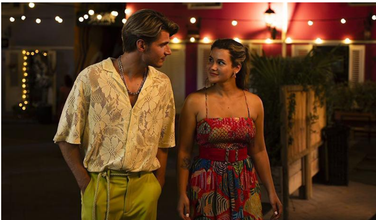
Кадр из фильма «Любовный переполох»