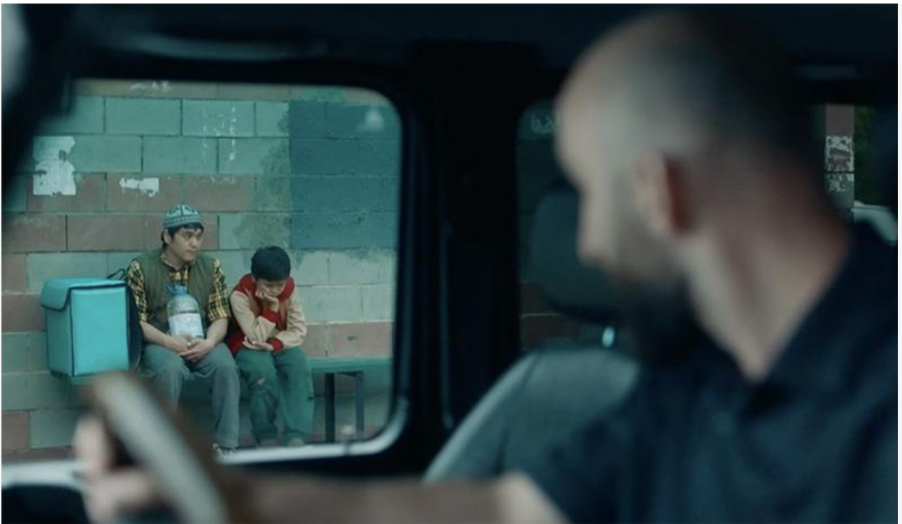
Кадр из фильма «Рай под ногами матерей 2: Письмо матери»