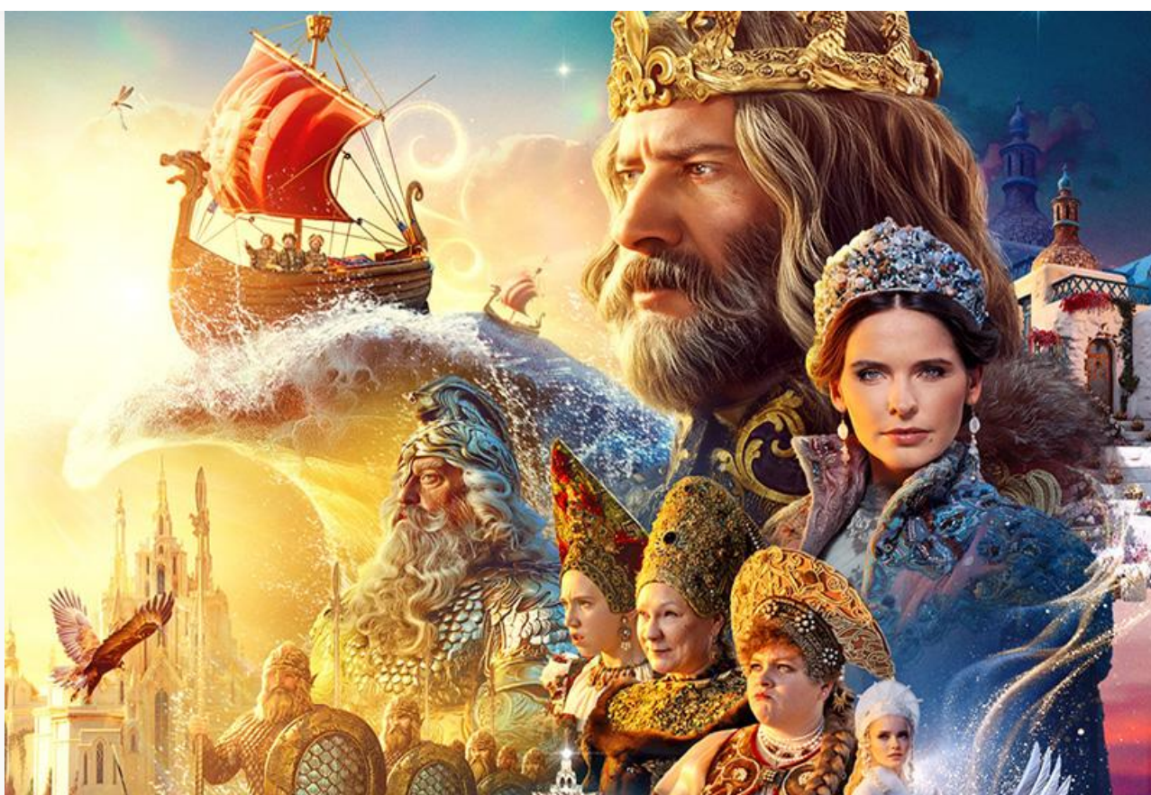
Постер к фильму «Сказка о царе Салтане»

Ещё один плодovито-безвкусный деятель отечественного кино – Марюс Вайсберг – представит комедию для взрослых « Уволить Жору » (18+) с Дániлой Козловским, Михаилом Галустьяном и Натальей Бардо.