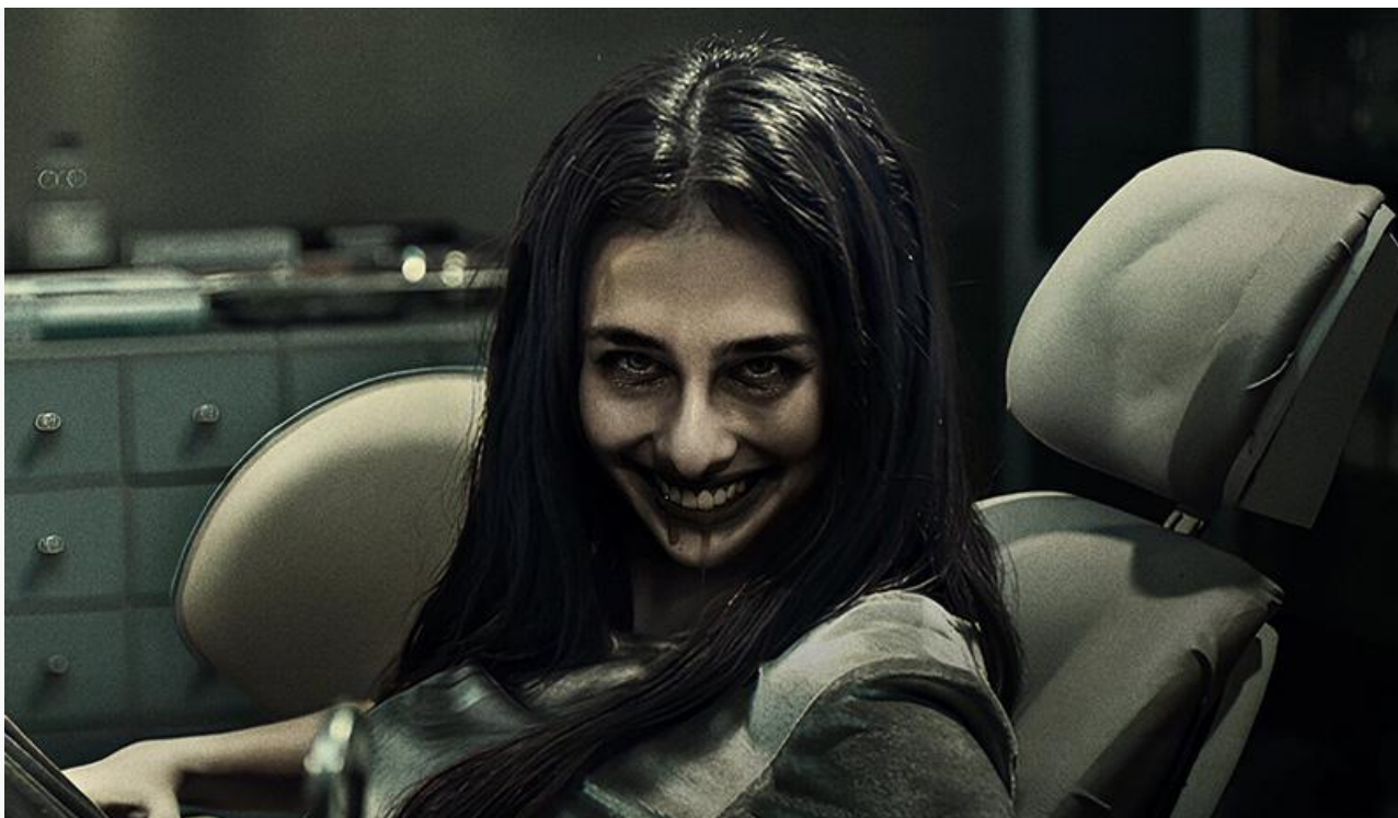
Постер к фильму «Улыбка. Зарождение зла»