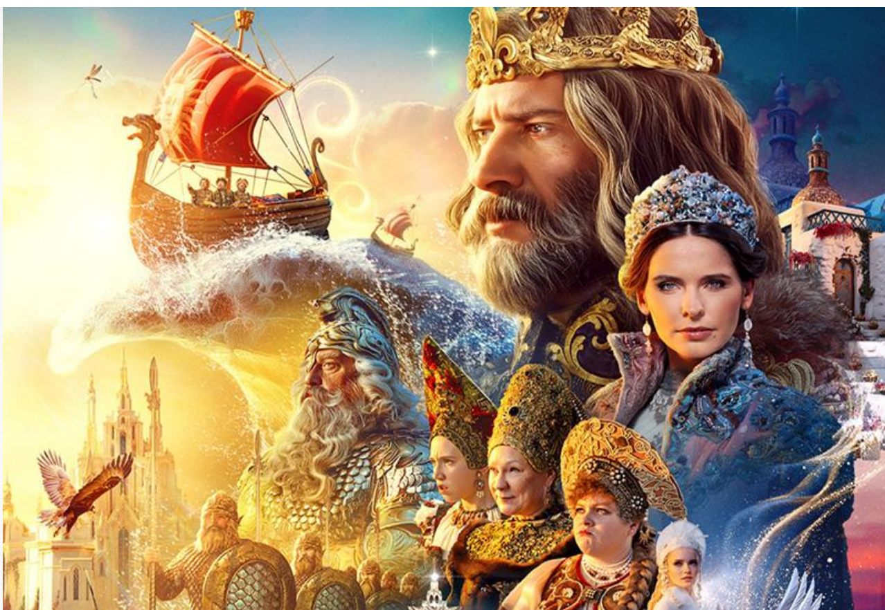
Постер к фильму «Сказка о царе Салтане»

Ещё один плодovито-безвкусный деятель отечественного кино – Марюс Вайсберг – представит комедию для взрослых «Уволить Жору» (18+) с Данилой Козловским, Михаилом Галустяном и Натальей Бардо.