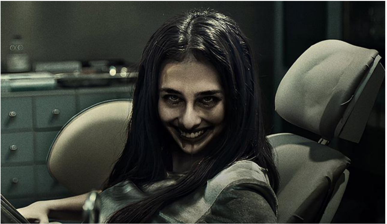
Постер к фильму «Улыбка. Зарождение зла»