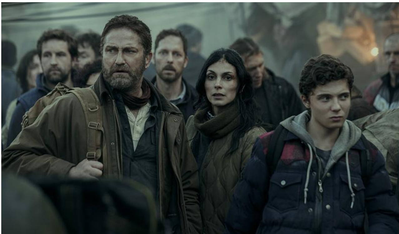
Кадр из фильма «Гренландия 2: Миграция»