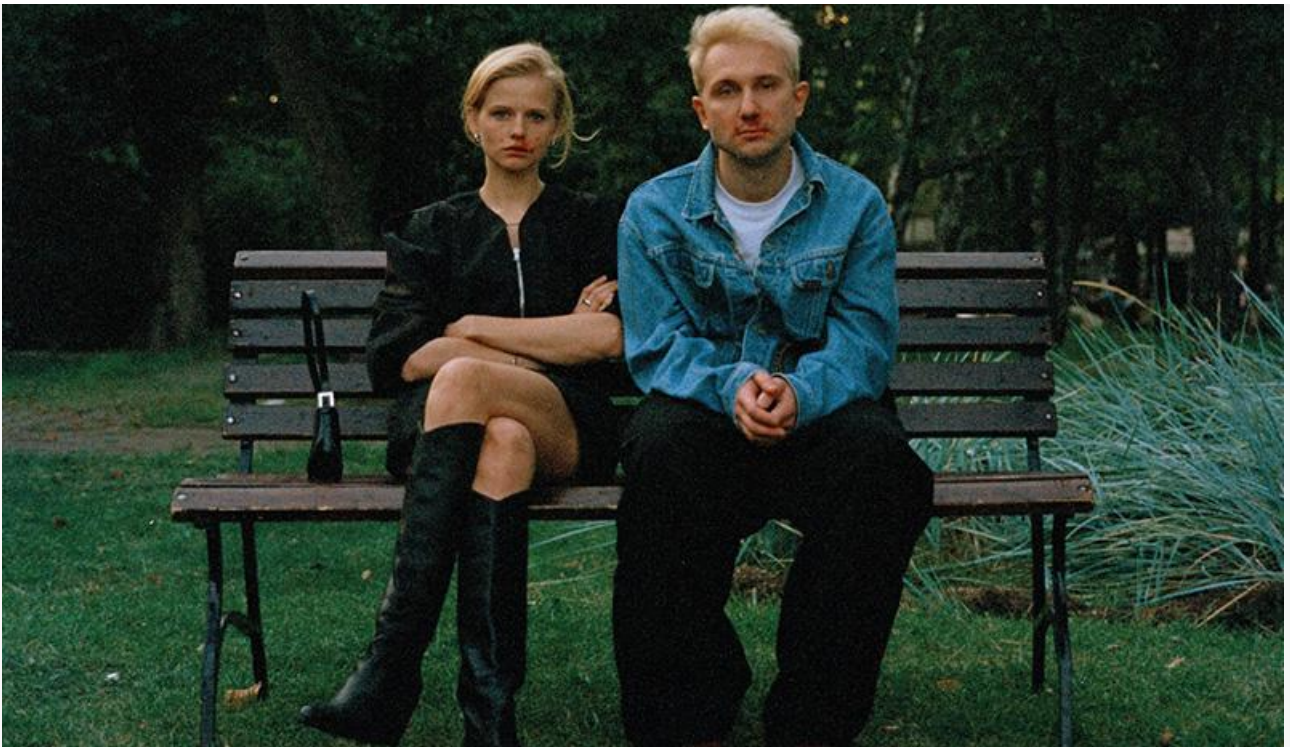
Постер к фильму «Счастлив, когда ты нет»