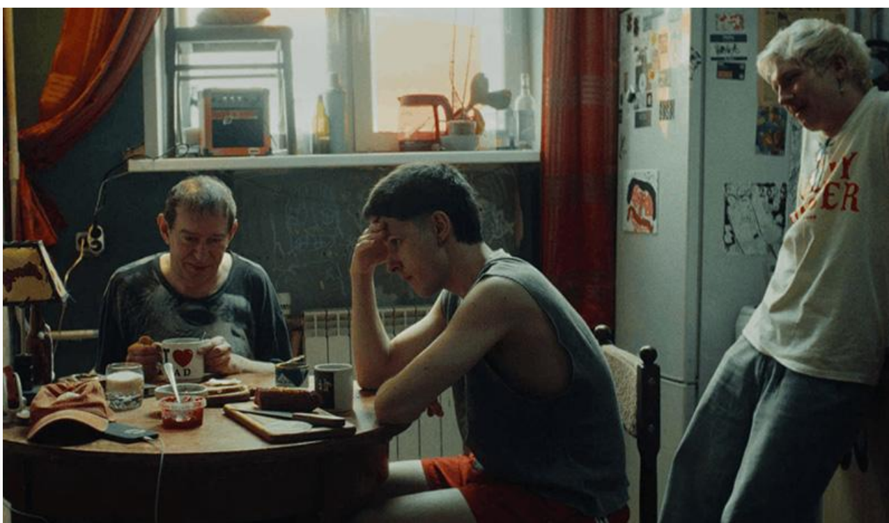
Кадр из фильма «Здесь был Юра»

Лидерство в прокате, потеряв в сборах по сравнению с предыдущими выходными 22 %, ожидаемо сохранила «Горничная», пополнившая копилку на 157 миллионов рублей при средней посещаемости 26 зрителей за сеанс. На минувшей неделе триллер Пола Фига официально вступил в «Клуб миллиардеров» российского проката 2026 года, где его удивлённо встретили местные «Чебурашка 2», «Простоквашино» и «Буратино».