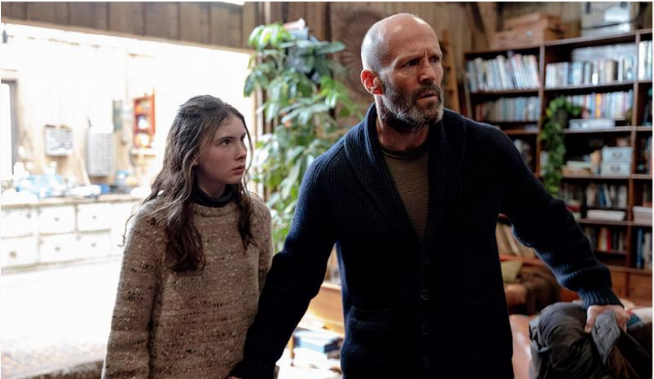
Кадр из фильма «Убежище»

По данным портала Kinobusiness.com и ЕАИС, лучшей новинкой уикенда с суммой 95,1 миллиона, собранной на 1 415 экранах за 12 тысяч сеансов, стал боевик Рика Романа Во «Убежище» с Джейсоном Стэйтемом в главной роли. Средняя посещаемость экшн-триллера, встретившего утро первого понедельника в России на второй строке чарта, составила 14 зрителей за сеанс.