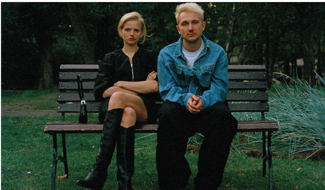
Постер к фильму «Счастлив, когда ты нет»