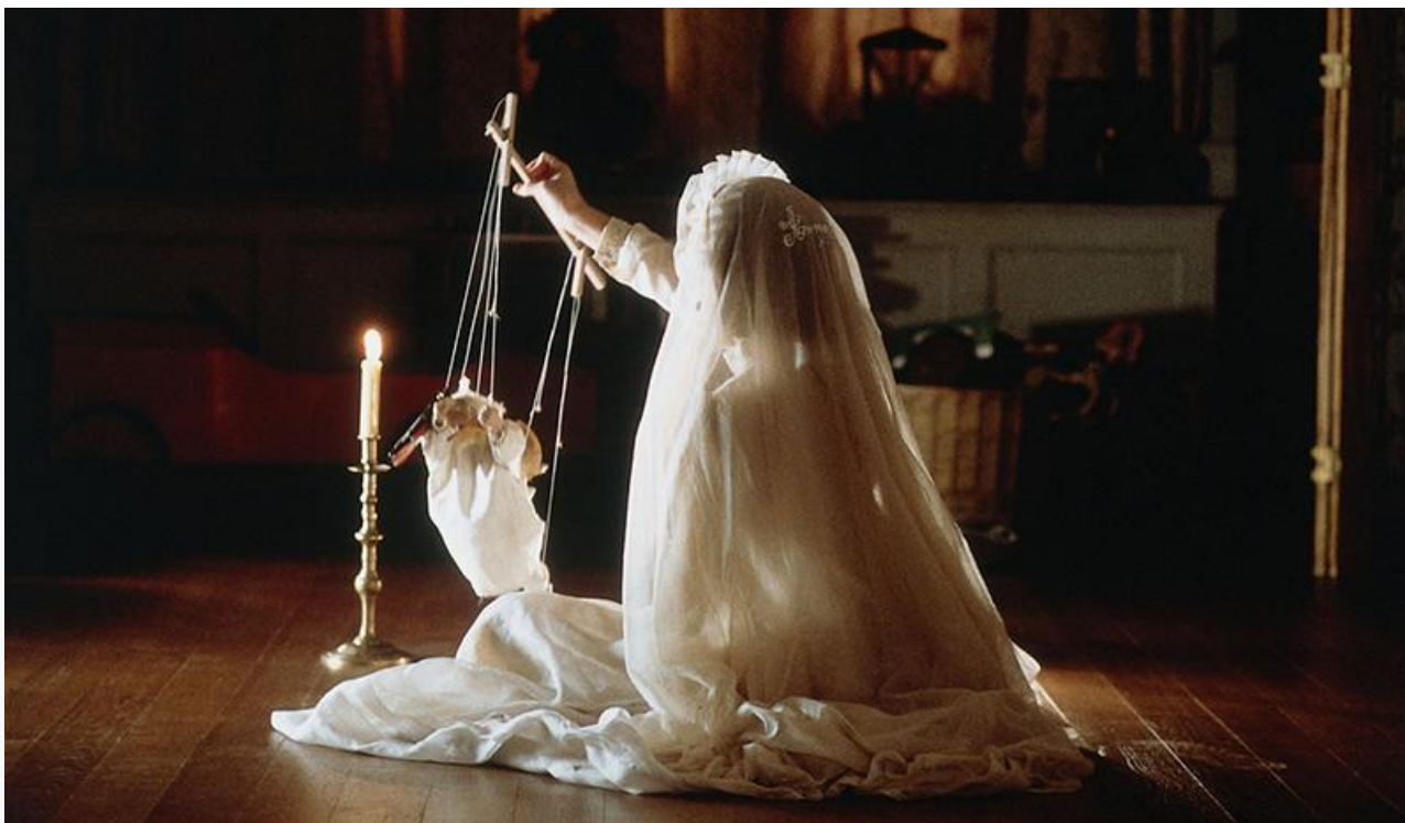
Кадр из фильма «Другие»