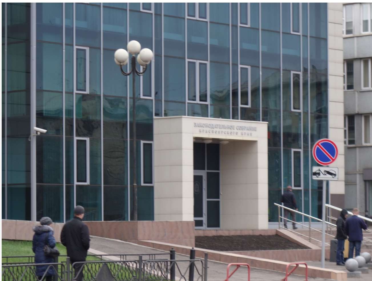
Автор: Алёна Штерн Фото из альбома "Красноярск. Правительство и ЗС Красноярского края" © Фотобанк "RuBabr"

Автор: Александр Мур © Babr24.com ПОЛИТИКА, КРАСНОЯРСК 👁 359 13.02.2026, 13:46