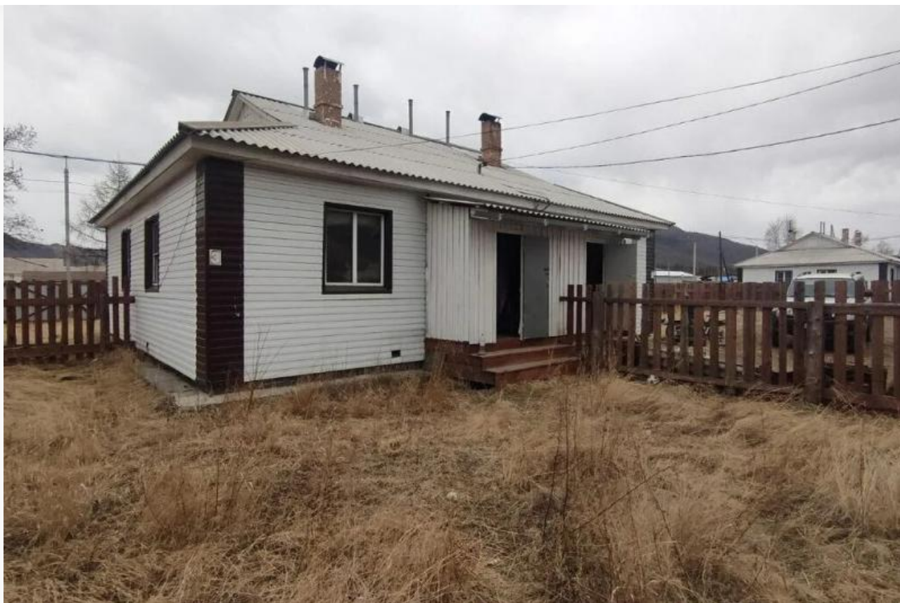
Дом для сирот в Закаменске

В рамках уголовного производства остальные квартиры также были признаны непригодными, но в очередь этих людей до сих пор не восстановили.