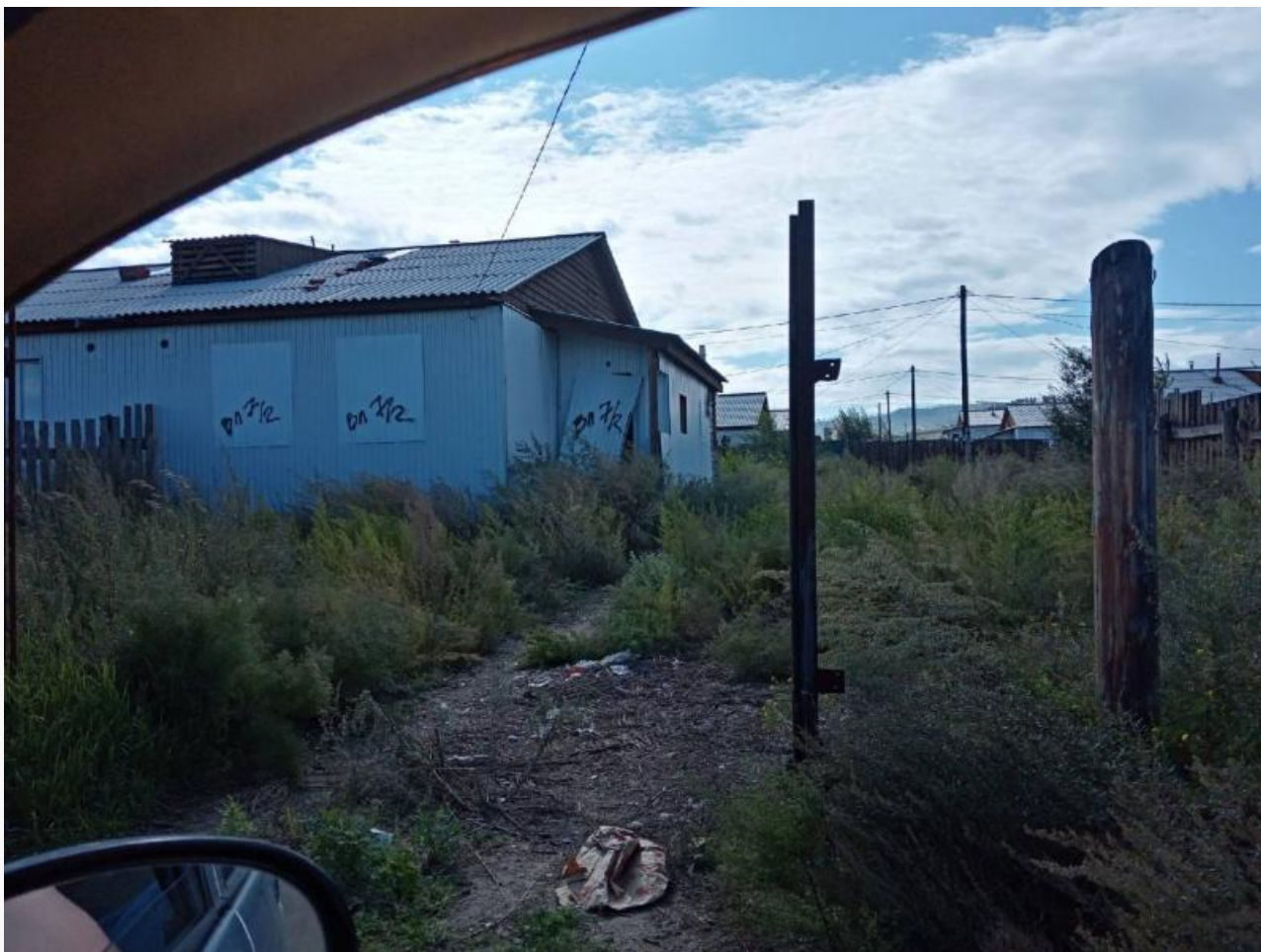
Сиротское гетто в Сотниково