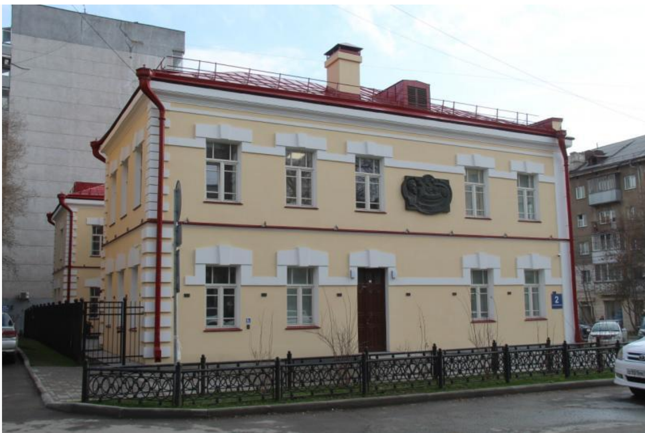
Дом Кондратюка (Советская, 24)