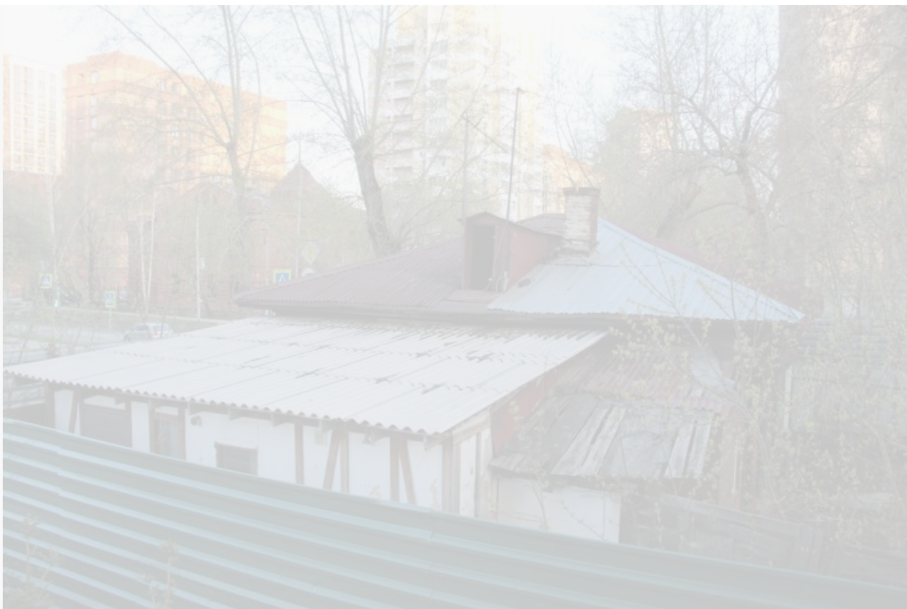
Дом Янки Дягилевой (Ядринцевская, 61)