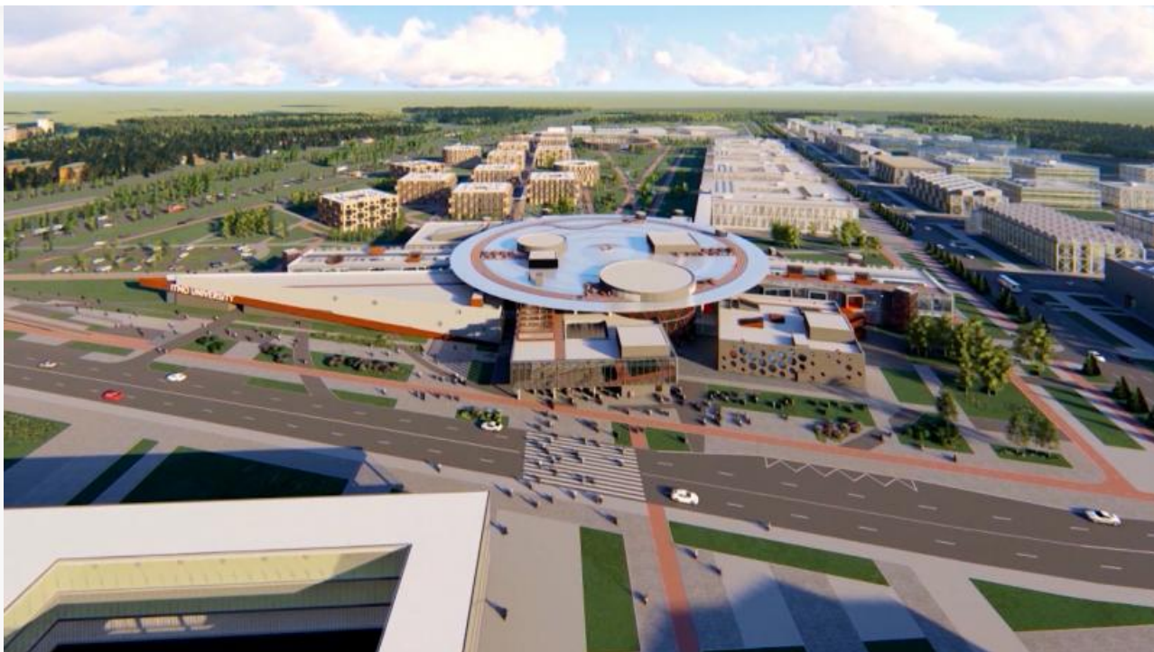
Старт строительству жилых домов первой очереди Южного дали весной 2025 года (на иллюстрации проект)