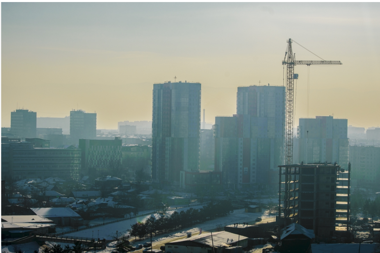
Автор: Иван Лебедев Фото из альбома "Красноярск. Зима" © Фотобанк "RuBabr"

Экологические проблемы Красноярского края давно перестали быть локальными. Это не отдельные ЧП, а цепочка взаимосвязанных решений — или, точнее, их отсутствия. И пока ответственность будут перекладывать с операторов на морозы, с собственников на «выравнивание рельефа», а с жителей на «нерадивых соседей», зима за зимой будет показывать одно и то же: система не работает.