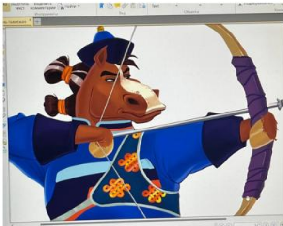
Работы других участников, не получивших призовые места