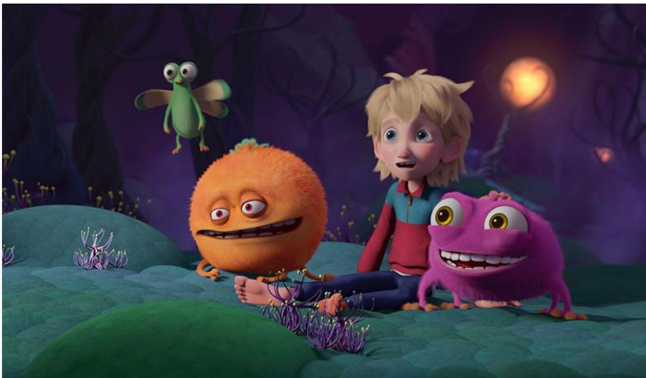
Кадр из фильма «Флибубу»

Покинули десятку лидеров проката «Иллюзия обмана 3», «Синистер. Первое проклятие» и «Добрый доктор».