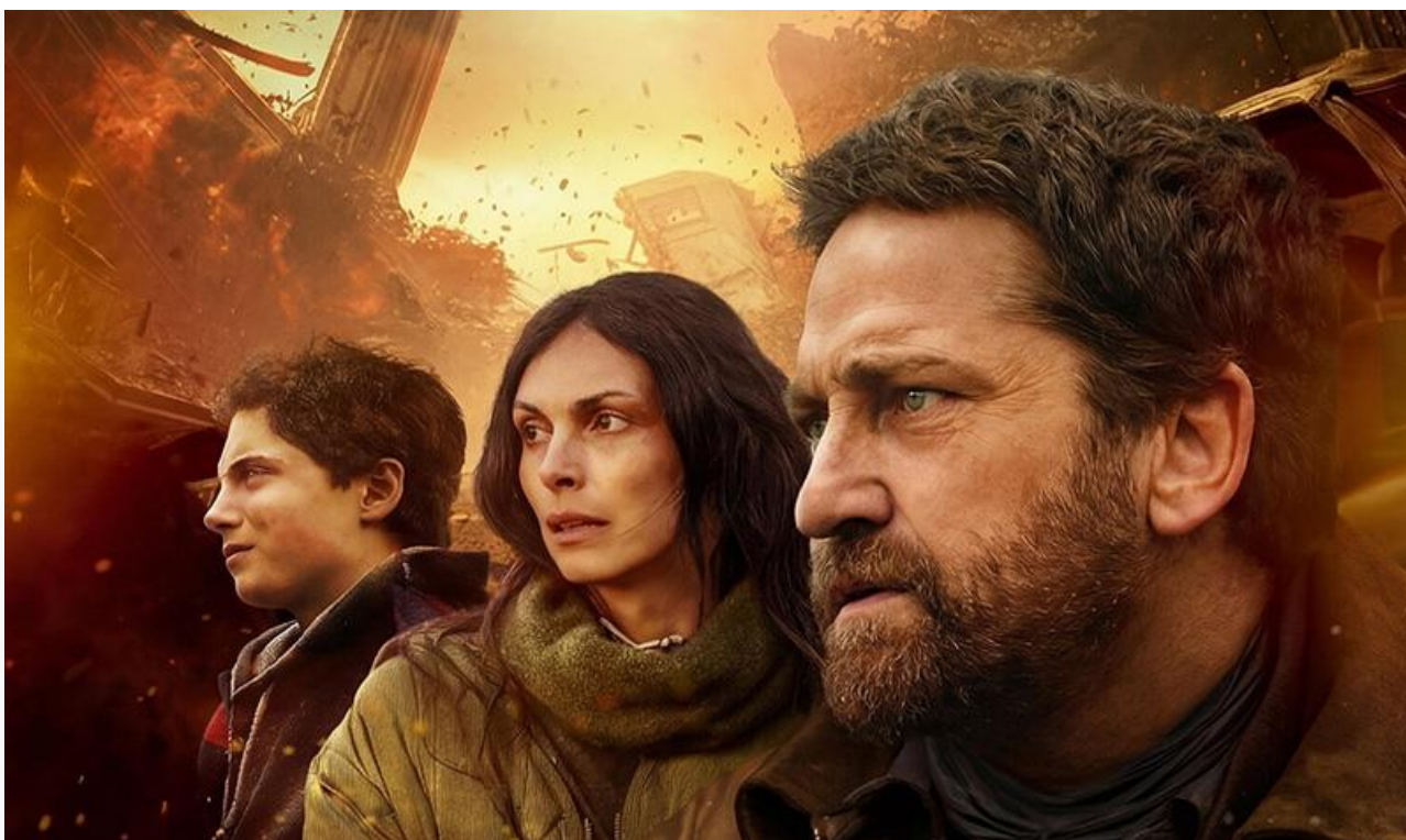
Постер к фильму «Гренландия 2: Миграция»