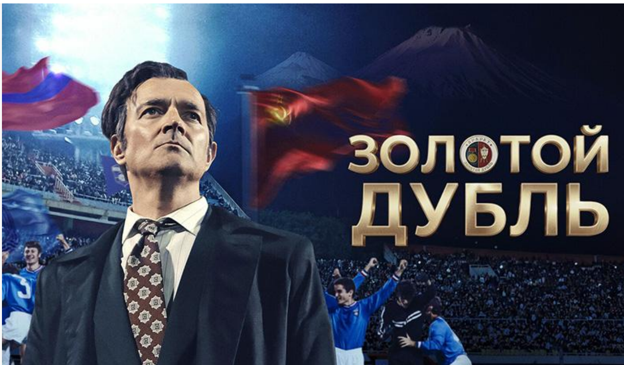
Постер к фильму «Золотой дубль»