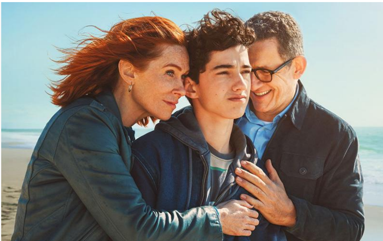
Постер к фильму «Отпуск по семейным обстоятельствам»