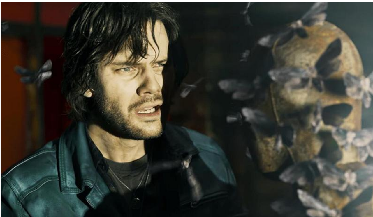
Джереми Ирвин в фильме «Возвращение в Сайлент Хилл»