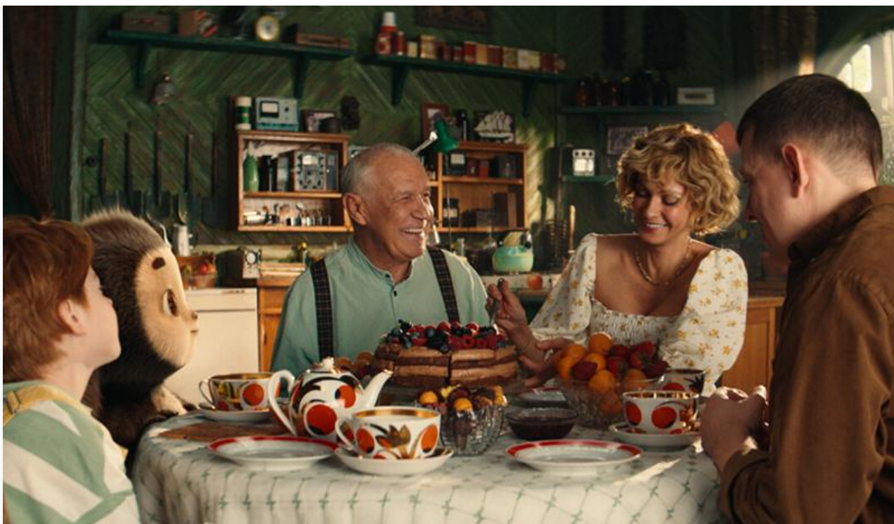
Кадр из фильма «Чебурашка 2»

Стоит отметить, что сиквел сдаёт позиции быстрее первой части (в основном из-за более сильной конкуренции в прокате) и по числу проданных билетов отстаёт от неё на 33 %. При этом общие сборы «Чебурашки 2» к вечеру воскресенья достигли 5,7 миллиарда. Это на 700 миллионов больше, чем было три года назад к концу четвёртого уикенда у первого «Чебурашки».