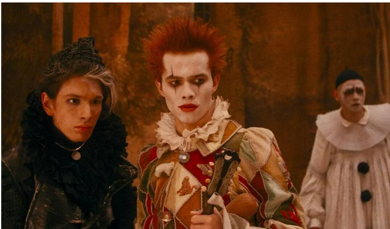
Кадр из фильма «Буратино»

Также сохранили места в десятке лидеров проката «Марти Великолепный» (59,3 миллиона с потерей в сборах 14 % и седьмое место), «Три богатыря и свет клином» (6,6 миллиона с потерей в сборах 56 % и восьмое место) и «Убойная суббота» (3,8 миллиона с потерей в сборах 74 % и десятое место).