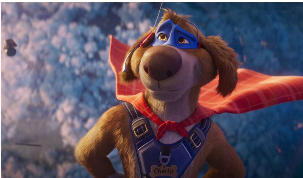
Кадр из фильма «Чарли Чудо-пёс»