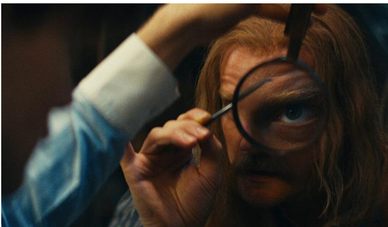
Юрий Колокольников в фильме «Левша»