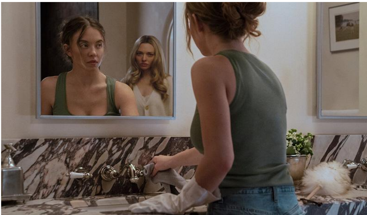
Кадр из фильма «Горничная»

«Простоквашино» и «Буратино» потеряли в сборах по 46 % и с суммами 71,1 миллиона и 67 миллионов опустились соответственно на 5 и 6 строки чарта.