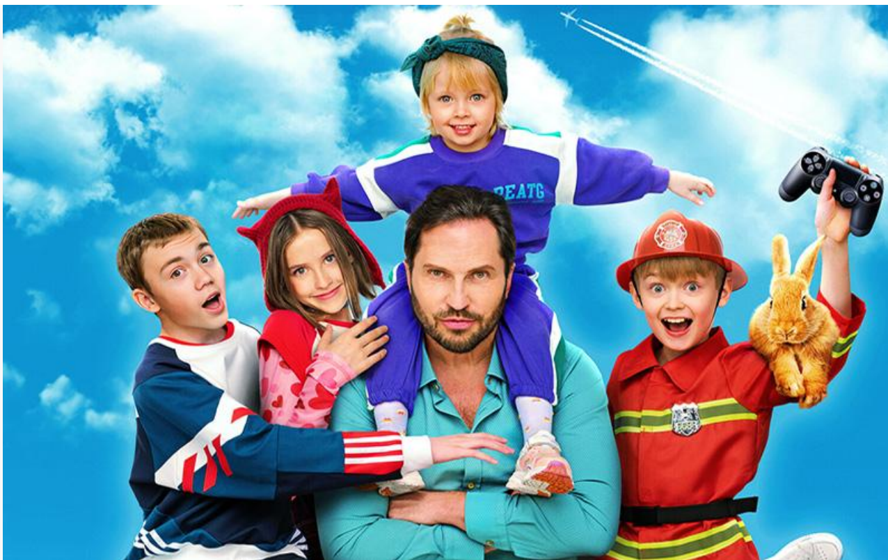
Постер к фильму «Папа может!»