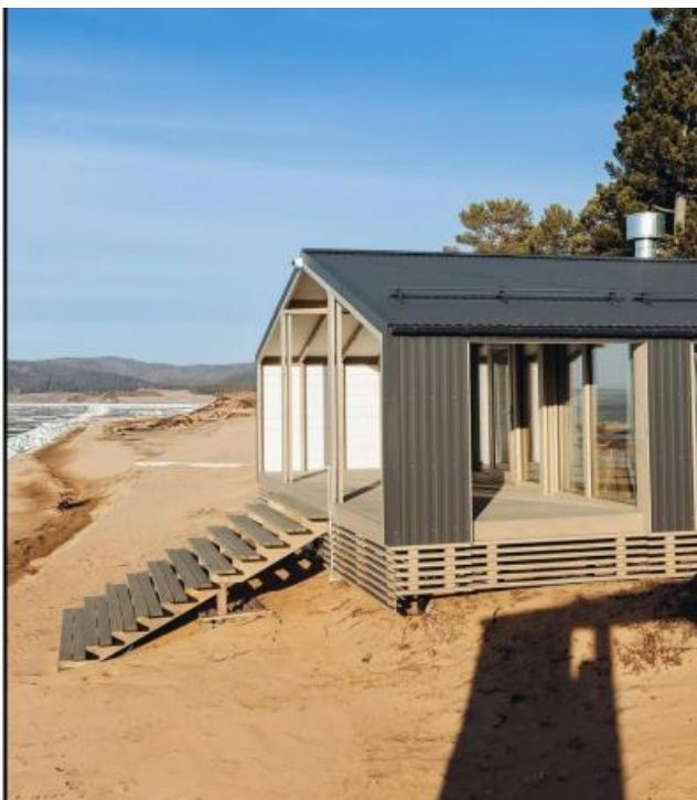
Новые видовые домики (рендер) и баня на берегу Байкала проекта АМАР