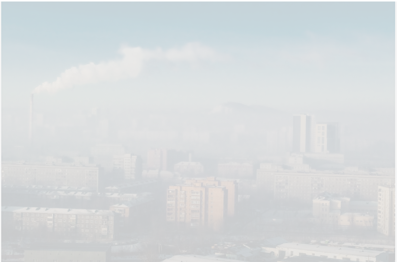
Автор: Иван Лебедев Фото из альбома "Красноярск. Зима" © Фотобанк "RuBabr"

А ведь именно на этих данных строятся прогнозы смога и принимается решение о введении режимов НМУ. Когда информация искажена, режим либо вводят слишком поздно, либо ограничиваются первой степенью, даже если ситуация требует более жёстких мер. Это напрямую влияет на здоровье сотен тысяч людей.