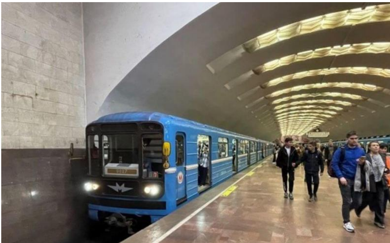
Фото: nsk-metro.ru .

Автор: Ярослава Грин © Babr24.com Источник: t.me/sidpolit ТРАНСПОРТ, НОВОСИБИРСК 6