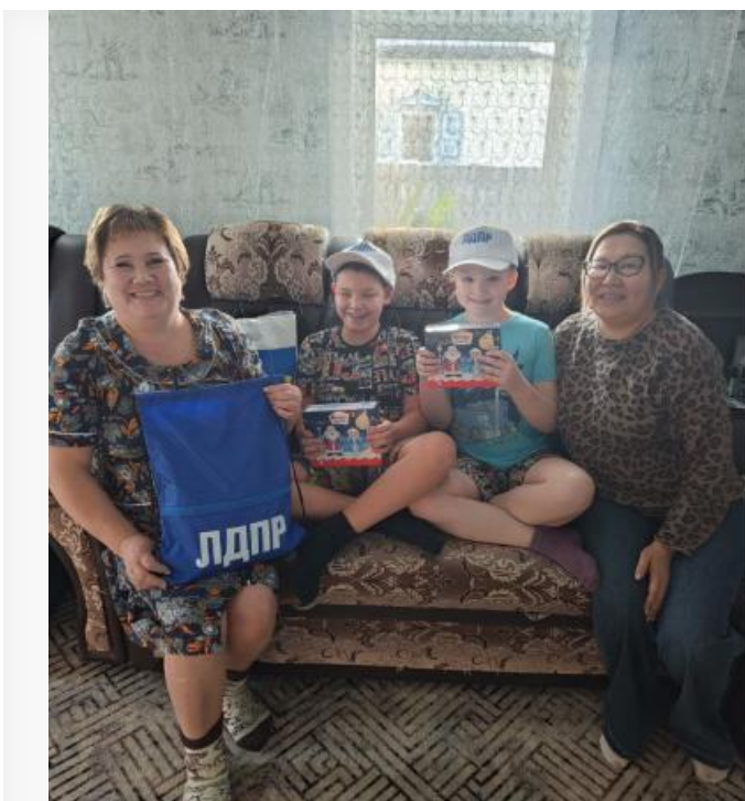
Депутаты ЛДПР вручают подарки

ЛДПР понимает своего избирателя. Это простые люди, которым безразлична высокая политика. Им нужны дрова, бесплатный юрист и спортивная секция для ребёнка. Эта тактика работает. По данным ВЦИОМ за 2024 год, ЛДПР опередила коммунистов в общем рейтинге (10,9% против 9,9%), хотя у КПРФ остаётся потенциал для роста на протесте.