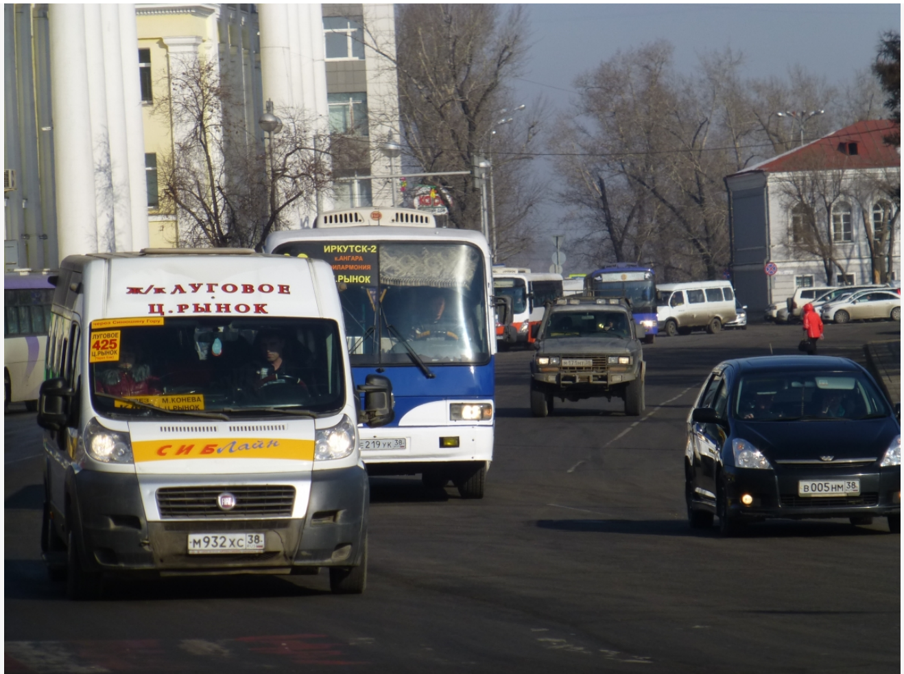
Автор: Даниил Тетерин Фото из альбома "Автобусы" © Фотобанк "RuBabr"

Автор: Алина Саратова © Babr24.com ТРАНСПОРТ, ОБЩЕСТВО, ИРКУТСК, КРАСНОЯРСК, БУРЯТИЯ 103 27.01.2026, 11:23