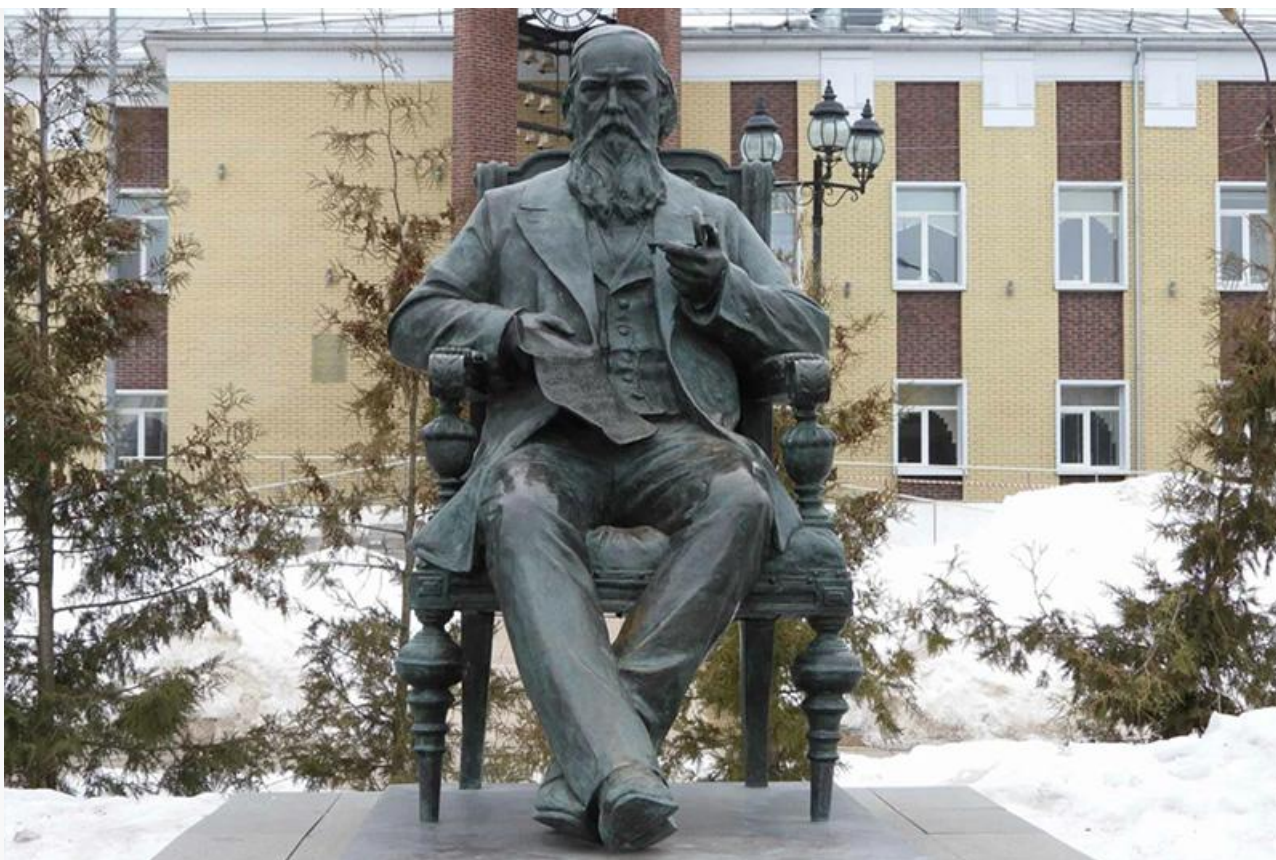
Памятник Салтыкову-Щедрину работы