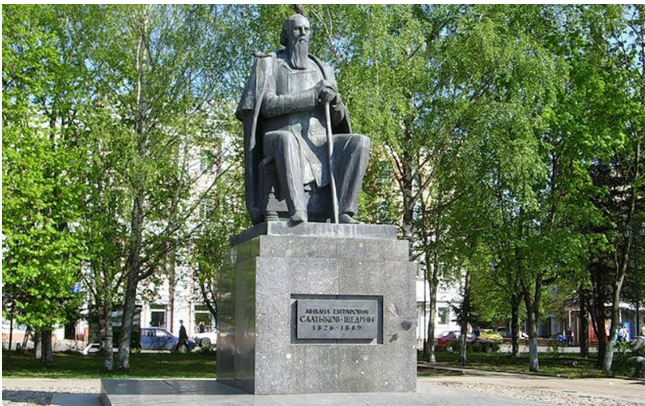
Памятник Салтыкову-Щедрину работы скульптора Олега Комова на Тверской площади в Твери