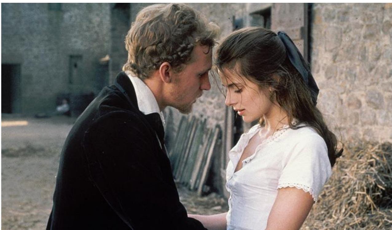
Тэсс Дербифилд в фильме «Тэсс». Великобритания, Франция, 1979 год

В фильмографии Настасьи Кински, активно снимавшейся и в Европе, и в Голливуде, более 60 фильмов и сериалов.