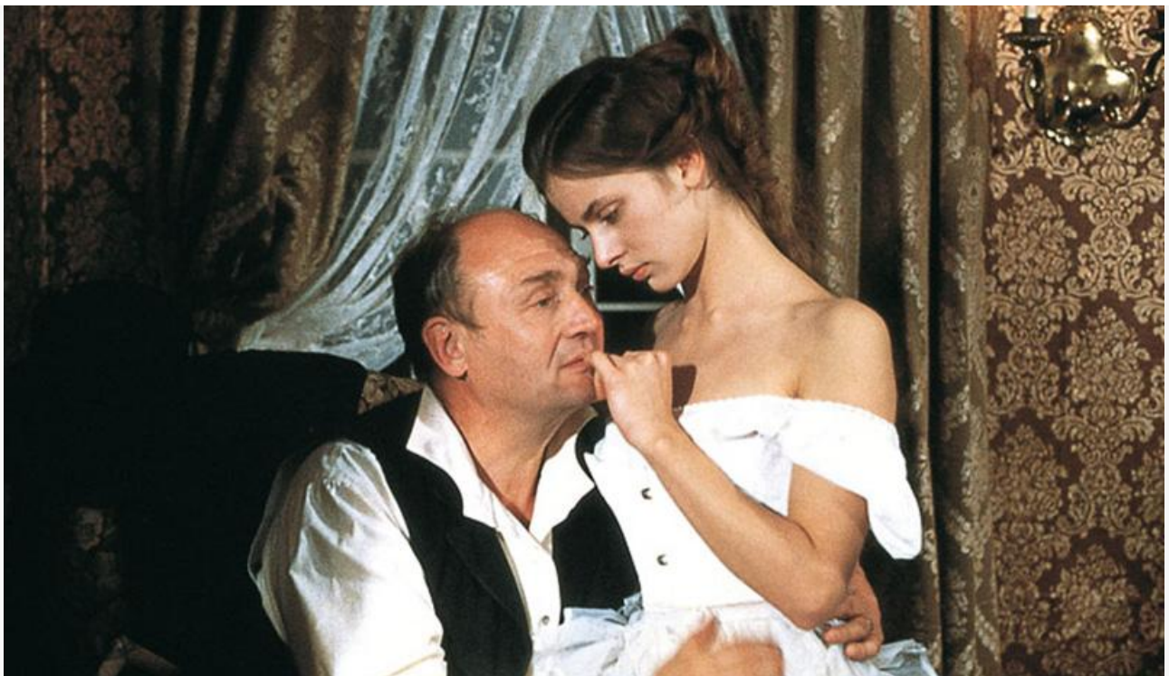
Клара Вик в фильме «Весенняя симфония». Германия, 1983 год