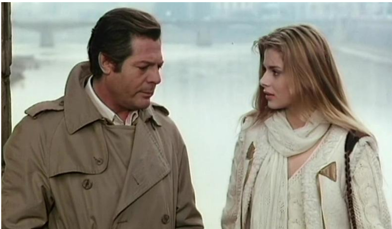
С Марчелло Мастроянни в фильме «Такая, как ты есть». Италия, Испания, 1978 год