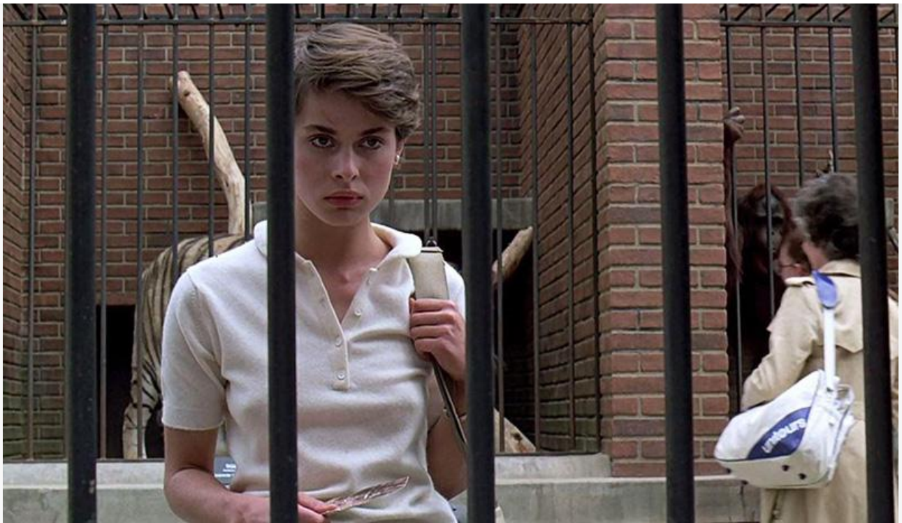
Ирена Галлиер в фильме «Люди-кошки». США, 1982 год

Партнёрами Кински в разные годы были Марчелло Мастоияни, Жерар Депардьё, Рудольф Нуриев, Аль Пачино, Тимоти Хаттон, Чарли Шин, Уиллем Дефо, Гэбриел Бирн, Робин Уильямс, Тимоти Далтон, Кристофер Ламберт, Никита Михалков, Виктор Раков и другие звёзды мирового экрана.