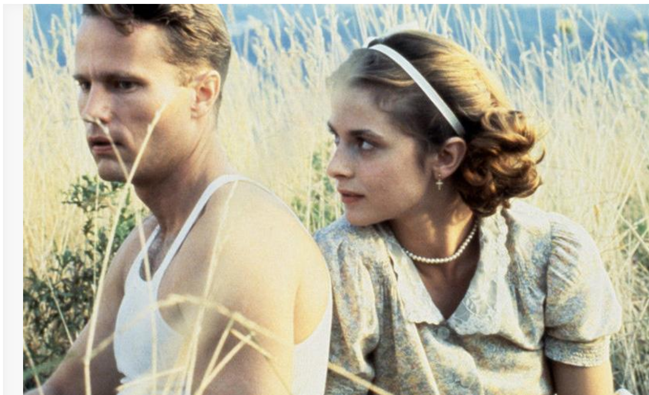
Мария в фильме «Возлюбленные Марии». США, 1984 год

В 2018 году «наша немка» была удостоена специального приза «Верю. Константин Станиславский» Московского международного кинофестиваля.