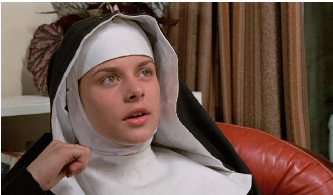
Катерина Беддоуз в фильме «Дочь для Дьявола». Великобритания, Германия, 1976 год