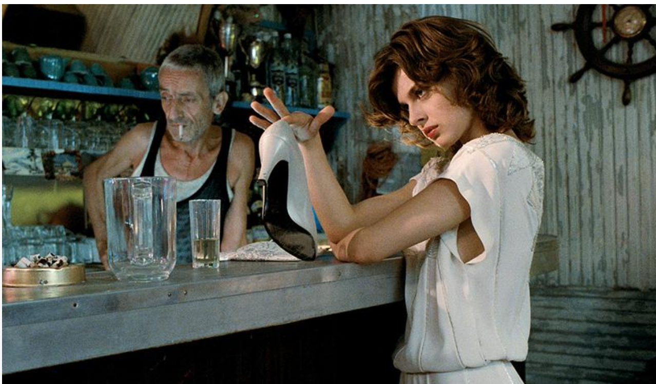
Лоретта в фильме «Луна в сточной канаве». Франция, Италия, 1983 год