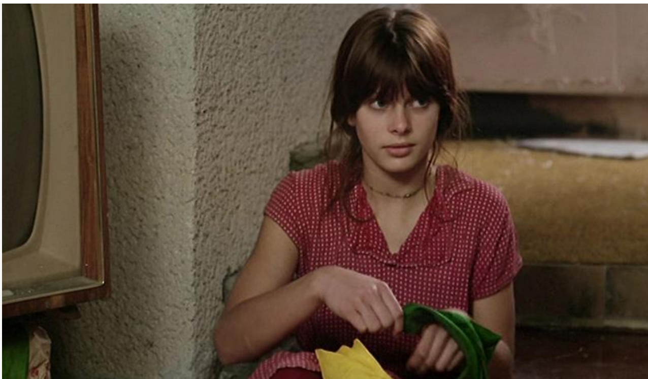
Миньон в фильме «Ложное движение». Первая роль в кино. Германия, 1975 год

номинации на премии «Золотой глобус» и «Сезар» в категории «Лучшая женская роль» и статуэтку «Золотого глобуса» в категории «Прорыв года».