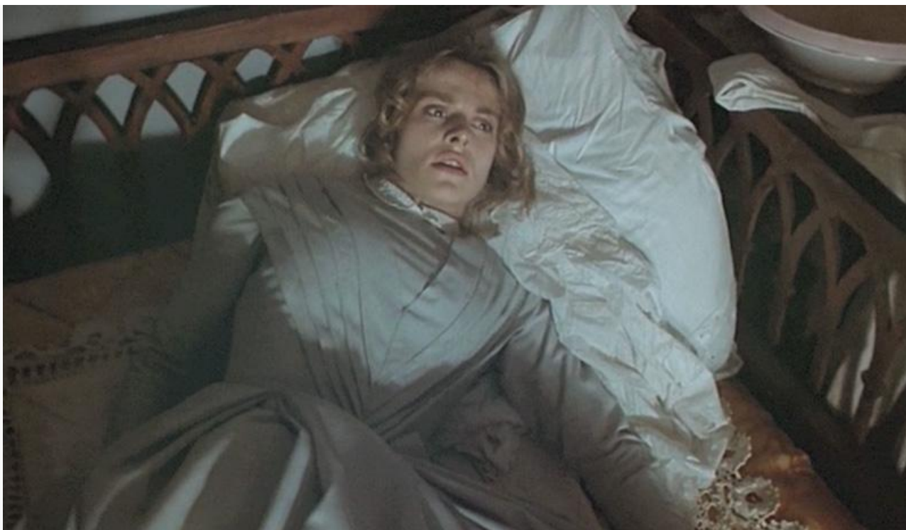
Наташа в фильме «Униженные и оскорблённые». СССР, Швейцария, Италия, 1991 год