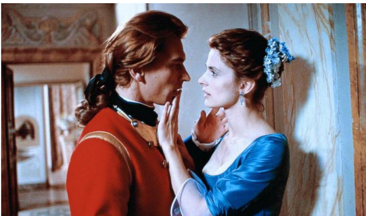
Кристина дель Карпио в фильме «И свет во тьме светит». Италия, Франция, Германия, 1990 год