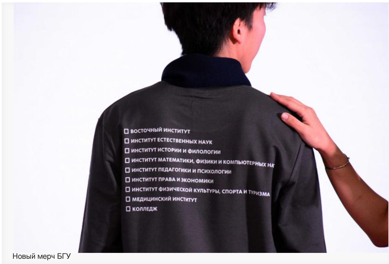
Новый мерч БГУ

Отметим, БГУ участвует в федеральной программе «Приоритет-2030». В конце 2025 года вуз подтвердил статус и получил грант в 100 миллионов рублей. В заявке на грант университет пообещал создать к 2030 году полный цикл разработки лекарственных препаратов. Планы амбициозные: производство 20 видов биологически активных добавок (БАД) и десяти наименований лечебной косметики.