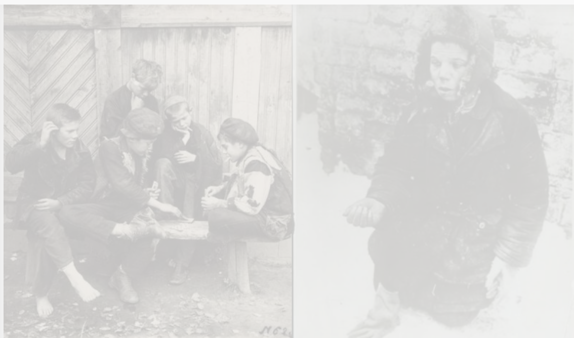
Беспризорники, 1920-е годы. Беспризорник, 1924 год

В прессе начала 1920-х годов писали, что голодные и синие от холода дети часто просили милостыню около красноярских кинотеатров. Большая часть сирот влилась в преступный мир, регулярно фигурируя в криминальной хронике. Поэтому насущным вопросом для города было открытие ночлежных домов для детей.