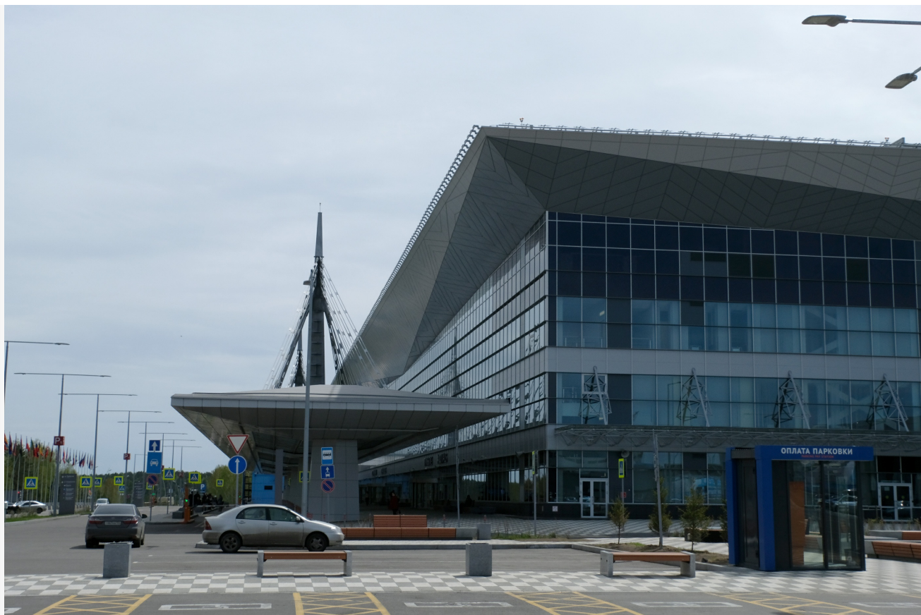
Автор: Алёна Штерн Фото из альбома "Красноярск. Аэропорт Емельяново" © Фотобанк "RuBabr"

Автор: Александр Мур © Babr24.com ТУРИЗМ, ТРАНСПОРТ, КРАСНОЯРСК 👁 18 23.01.2026, 12:51